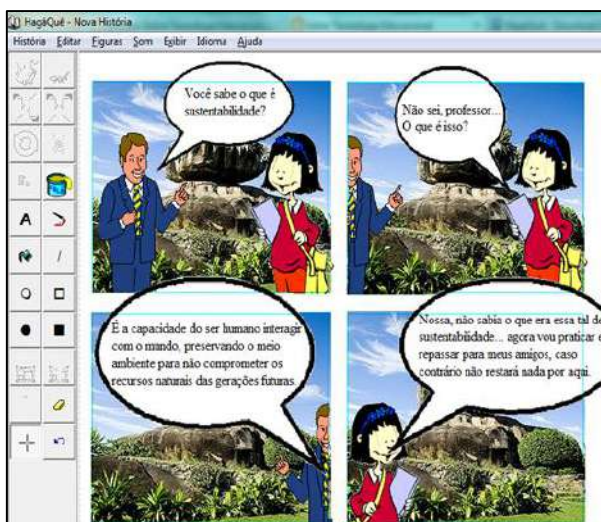
Fig. 1- História em quadrinhos criada pelos alunos em HagaQue