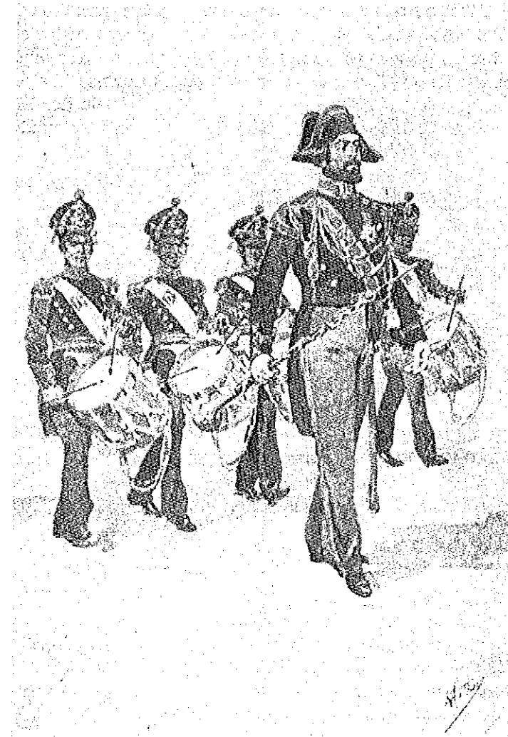
A TESTA DE COLUMNA DO BATALHÃO NAVAL, EM 1852 Última aguarela de Ribeiro Arthur

Assim e se existem algumas publicações sobre uniformes, o certo é que ainda hoje não existe publicado nenhum trabalho que estude as notáveis colecções existentes em arquivos tão diversos e vastos como a Torre do Tombo, Biblioteca Militar, Escola Superior de Belas Artes, Arquivo Histórico Colonial ou Arquivo Histórico Militar ( 65 ),