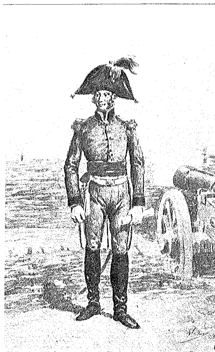
ARTILHEIRO CONDUTOR EM GRANDE UNIFORME — 1891 (Inspirado na gravura anterior)

Algumas das suas obras foram expostas e muito «admiradas» na Exposição de Paris de 1900 (56) ; em 1908 e integrado na Secção Portuguesa de Belas Artes, apresenta aguarelas de uniformes, na Exposição Nacional do Rio de Janeiro (57) .