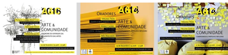
Fig. 1 Cartazes dos seminários 2014 —2016

quer ao nível das modalidades de colaboração, participação e inclusão através das práticas artísticas.