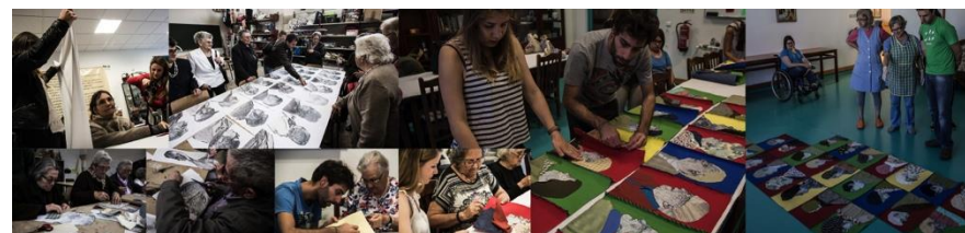
Fig. 7 Projeto “A Cor da Idade” 2015

entre estudantes e utentes, contando com a mediação da docente da UC que os acompanhou e do animador sociocultural do Centro que nos apoiou tanto nos procedimentos e objetivos, como nas dificuldades técnicas, sentidas ao longo do projeto (fig.7).