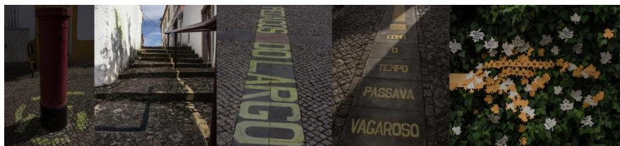
Fig. 4 Projeto “Linhas de Cerromaior” 2015

Mais do que a apropriação estética do espaço urbano a proposta de intervenção levantou várias questões ao longo do processo criativo, desde logo, i) a necessidade de estabelecer um conjunto de premissas em conjunto com técnicos responsáveis pelo planeamento e manutenção do centro histórico onde decorreram as intervenções de modo a encontrar uma solução que não comprometesse a configuração dos lugares; ii) o dever de auscultar a comunidade (em especial comerciantes e habitantes), pelo que foi realizada uma consulta porta a porta pelo grupo de estudantes acompanhados de uma técnica superior da Câmara Municipal com a apresentação da proposta de intervenção, de modo a perceber o acolhimento junto das pessoas; iii) a possibilidade de encontrar formas de participação da comunidade no projeto, pelo que, a dada altura, os transeuntes e/ou residentes foram convidados a deixar uma marca da sua passagem pelos lugares, designadamente através da inscrição do nome numa das folhas de cartolina colocadas junto à “Casa das Heras” (fig.4).