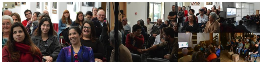
Fig. 8 Devolução dos projetos à comunidade 2015/ 2016

nos a considerar a importância da partilha de diferentes falas, designadamente daqueles que conhecendo realidades sociais, económicas e culturais diversas, dão um contributo valioso na formação dos estudantes de AVT, através da possibilidade de integrar uma dimensão coletiva e partilhada num campo tradicionalmente centrado no indivíduo-artista (fig.8).