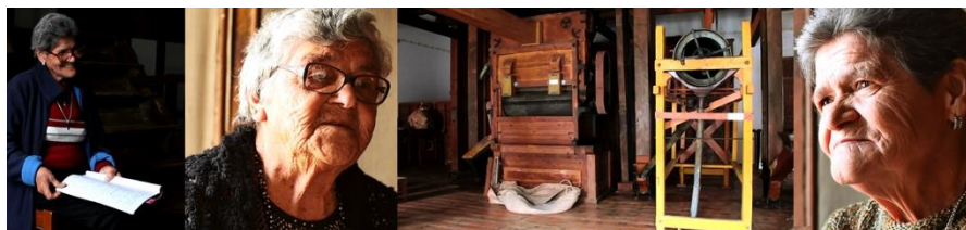
Fig. 3 Projeto “ Vivências” 2016 (fotografias de Catarina Alpoim)

ção e edição com vista a criar um objeto passível de integrar o percurso e o discurso museográficos (fig.3).