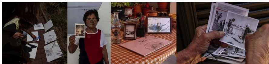
Fig. 5 Projeto “Memórias das Cabanas da Lagoa de Santo André” 2015

das nos painéis de azulejo constituíram-se na narrativa e imagética de um documentário. Deste modo, os azulejos deram corpo a uma memória coletiva mas, sobretudo, funcionaram como veículos de interação, epígrafes de contato com a comunidade corporizando os processos de partilha dessa memória, registados em áudio e vídeo. Os estudantes também entrevistaram, inscrevendo algumas das descrições que nos levaram ao tempo em que existiram Cabanas e gentes nas dunas da Costa de Santo André (fig.5).