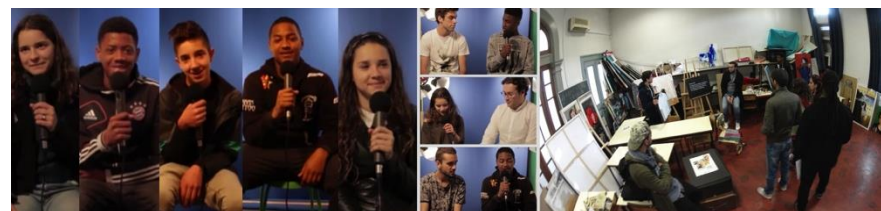
Fig. 6 Projeto “Horizontes” 2016

d) A montagem/ edição de todos os momentos e devolução do projeto à comunidade que culminou num único vídeo, da autoria dos estudantes de AVC, enquanto proposta artística, colaborativa. Grosso modo, um vídeo que agrega todas as opiniões “Antes” e “Após” dos jovens da Claquete e convida o espetador a refletir sobre as suas opiniões! Quando apresentado este vídeo, os jovens foram filmados, bem como as suas reações, ao confrontarem-se com “a sua própria mudança”! Importa ainda referir um momento intermédio, de iniciativa dos jovens da Claquete, de entrevistas realizadas aos estudantes de AVC sobre o seu sucesso/ motivações tanto no ensino básico/secundário como no superior. O produto final é um agregado, editado, de tudo todas estas fases e momentos. https://www.youtube.com/watch?v=yn4BcrPKvU0