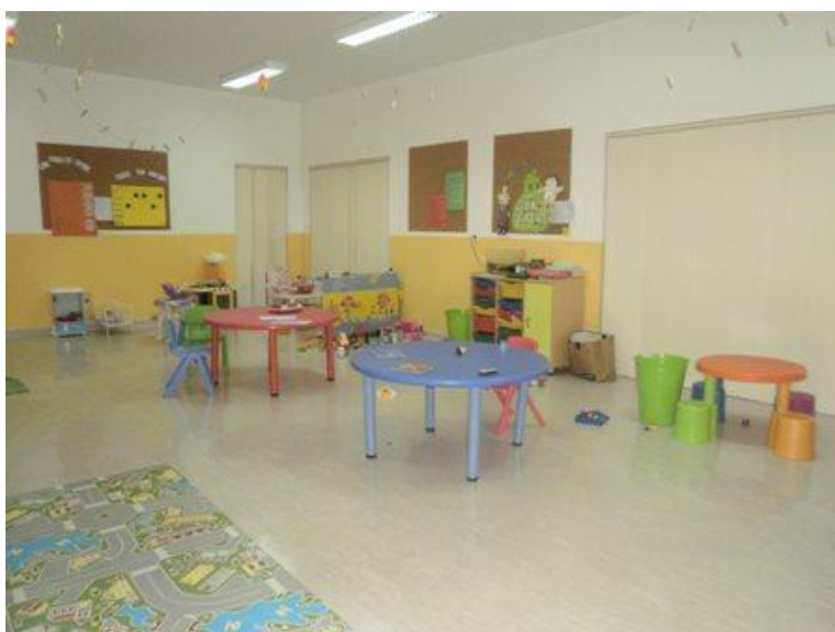
Sala Verde (Pré-Escolar)