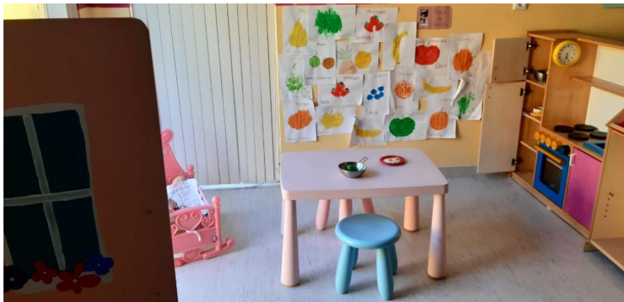
Área da Casinha