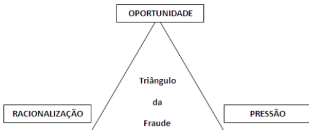
Figura 2 – Triângulo da fraude segundo Donald Cressy (1953)

Abdullah e Mansor (2015) citados por Xavier (2020), referem que em 2004, Wolfe e Hermanson apresentaram uma versão mais ampliada do Triângulo da Fraude: denominada por Diamante de Fraude ( The Fraud Diamond ). Este modelo mantém os elementos iniciais (pressão, racionalização e oportunidade) mas destaca-se do anterior pela inclusão de um novo elemento, a capacidade.