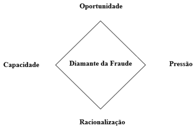
Figura 3 – Diamante da Fraude

Os autores consideram que o praticante tem de ter a capacidade e habilidade de cometer o ato ilícito e sem capacidade o ato de fraude não ocorre.