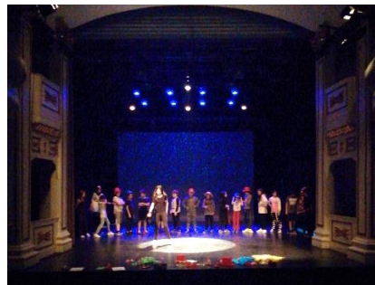
Apresentação dia 7 de junho