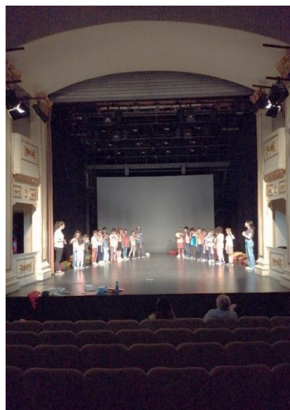
Ensaio no Palco