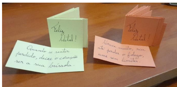
Prendas de Natal com frases de esperança