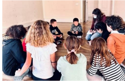
Aulas em Santa Clara