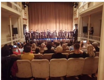
Apresentação dia 4 de junho