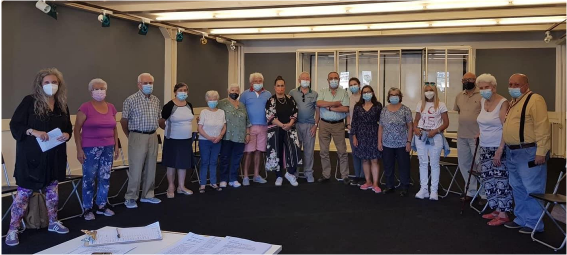
Primeira aula.