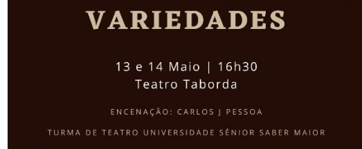
Cartaz do Espetáculo Final