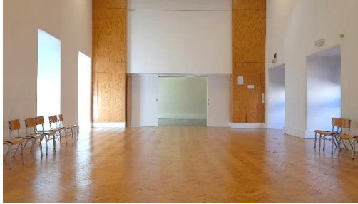
Anfiteatro de Santa Clara