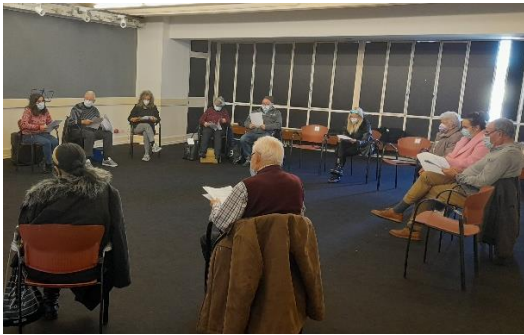
Aulas de Texto