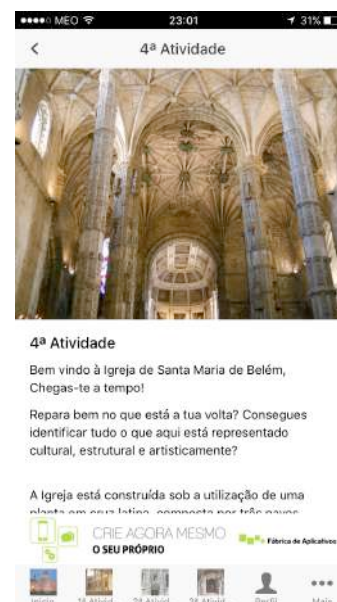
Fig. 2. 4ª Atividade na App

A construção desta App foi feita a partir do sítio virtual da Fábrica de Aplicativos ( www.fabricadeaplicativos.com.br ), uma plataforma online para criação de aplicativos com uma tecnologia que permite a qualquer utilizador criar uma aplicação virtual para smartphones de forma rápida, fácil e sem programação. Para este projeto de intervenção, o grupo de estudantes conseguiu, de forma gratuita, criar um protótipo da App e não uma versão completa visto que a criação de um aplicativo completo acarretaria custos elevados.