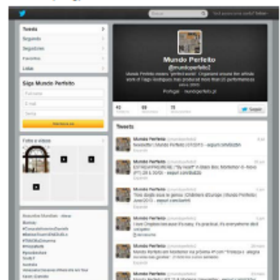
Imagem n.º 2: Página no Twitter da companhia Mundo Perfeito (2013)