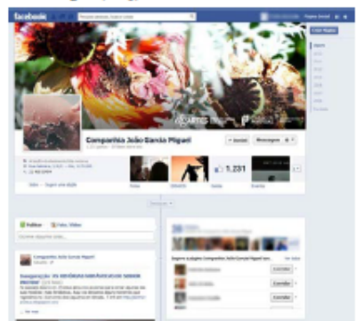
Imagem n.º 1: Página no Facebook da companhia João Garcia Miguel (2013)

Fonte: Facebook. https://www.facebook.com/CompanhiaJgm?ref=ts&fref=ts (acedido a 9 de julho de 2013)