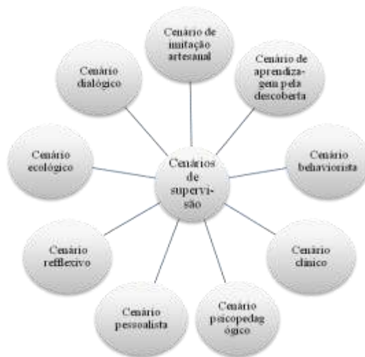
Fig.1 – Cenários de supervisão – Adaptada de Alarcão e Tavares (2003)

Alarcão e Tavares (2003), como podemos ver na figura que se segue (fig. 1), identificam vários tipos de supervisão e descrevem-nos como cenários possíveis de uma prática supervisiva, adequados ao contexto e à situação. São estratégias de supervisão que se interligam e são ajustáveis. Estes investigadores referem que cada cenário não deve ser visto como uma fórmula pronta a ser aplicada e não se faz acompanhar de um procedimento próprio.