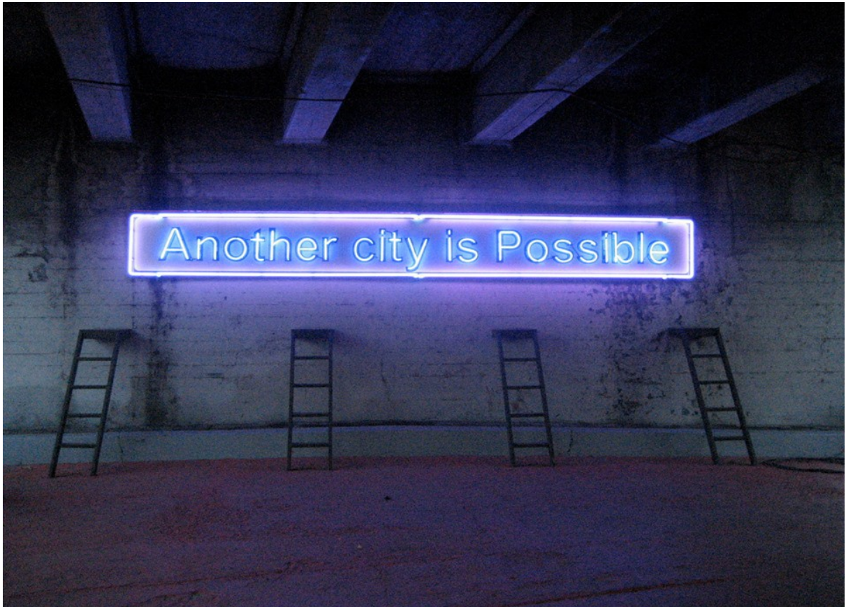
[ Artwork: Lauren Bon and the Metabolic Studio (2008) ]