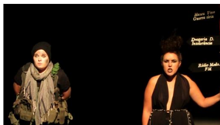
Figura 7 - Cena do Líder – pontual zona de diálogos

ilha de luz do soldado e do Coro é mais alaranjada e a temperatura na ilha da Louca é mais azulada. Esta opção procura aproximar as figuras do soldado e do Coro, tornando-as mais humanas e distanciar a figura da Louca, ao dar-lhe um ar mais frio, que é também característico das estátuas, tornando-a mais divina. Para além das ilhas criou-se uma luz pontual