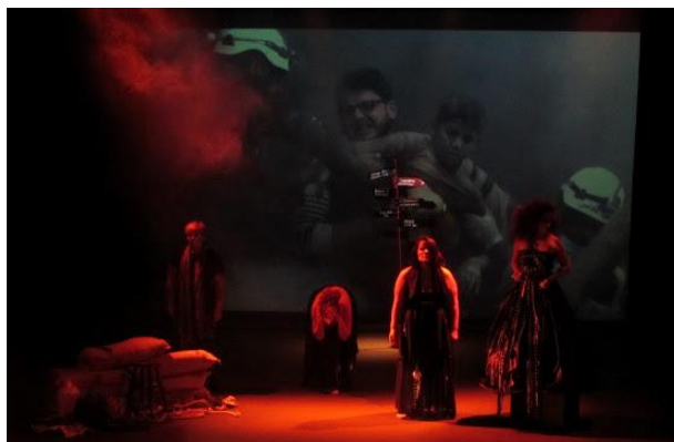
Figura 1 - Cena no final do espectáculo

As opções cenográficas do espectáculo relacionam-se com a procura do tal não-lugar. Nesse sentido a cena foi dividida em três grandes zonas: a zona do soldado, do lado esquerdo, na qual surge uma trincheira improvisada onde o soldado aguarda o desfecho da guerra, mas não há qualquer indicação de lugar. A opção