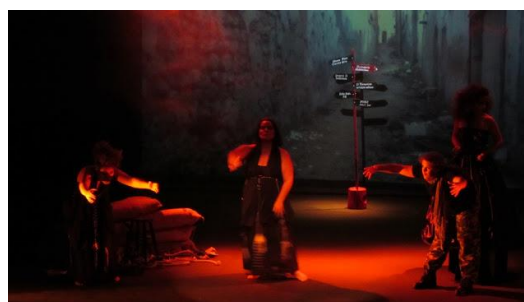
Figura 6 – Luz geral - cena final/Dança

de analepse, de forma rectangular ao centro, que delimita a zona de diálogos e trata-se de uma iluminação geral dessa zona, onde ocorrem os diálogos entre o soldado e a Zhaida e entre o soldado e o Líder. Existe, ainda, uma outra iluminação pontual, que é lateral, composta por dois projectores de recorte colocados nas duas laterais junto ao chão e que fazem a iluminação pontual do monólogo de Zhaida e de algumas intervenções da Louca, quando esta toma a frente da cena. É uma luz que brinca com as sombras, não iluminando o rosto de forma uniforme, procurando atribuir uma dimensão sombria a uma luz bastante quente, com filtros de cor âmbar, que atribuem uma certa dualidade à cena, porque sendo uma cor quente transmite harmonia e equilíbrio, mas também é a cor do fogo, rompendo com essa harmonia ao ser tão intensa. A iluminação de cor âmbar volta a surgir na cena da partitura de gestos e dança, mas já numa iluminação geral de toda a cena, cruzada e concentrada ao centro. O jogo com