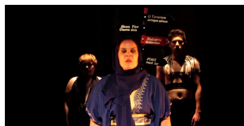
Figura 5 - Coro em contraluz, pontual Zhaida.

O desenho de luz do espectáculo foi pensado em função das diferentes zonas cénicas e concretizado com o auxílio do professor Miguel Cruz e de Henrique Moreira. Para as zonas do soldado, da Louca e do Coro foram criadas três ilhas de luz independentes, compostas por uma iluminação frontal e por contra-luz. A iluminação em contra-luz das três ilhas é praticamente constante, o que faz com que as figuras do soldado, do Coro e da Louca estejam sempre iluminadas em contra-luz, revelando-lhes as silhuetas e acentuando as suas presenças mesmo quando o foco está numa personagem ou figura. A iluminação dá-se em função do foco, iluminando cada ilha no momento do discurso ou da acção. A temperatura nas ilhas é distinta, sendo que a ilha de luz do soldado e do Coro é mais alaranjada e a temperatura na ilha da Louca é mais azulada. Esta opção procura aproximar as figuras do soldado e do Coro, tornando-as mais humanas e distanciar a figura da Louca, ao dar-lhe um ar mais frio, que é também característico das estátuas, tornando-a mais divina. Para além das ilhas criou-se uma luz pontual