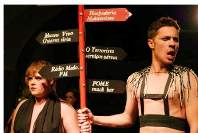
Figura 3 – Coro

árabe - hijab . A opção pela cor azul tem uma relação directa com a personagem, tanto por a cor azul ser comumente associada ao mar, lugar dos desastres, como por o azul representar a sua identidade marroquina, sendo o azul a cor de uma das mais conhecidas