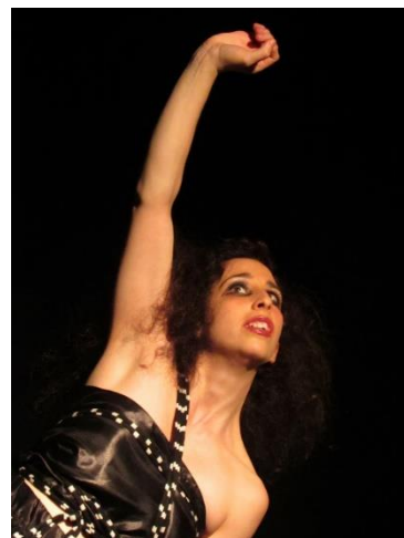
Figura 2 – Louca

Os figurinos para o espectáculo foram idealizados e criados por Helena Raposo, à excepção dos figurinos do soldado e da Zhaida, tendo em conta uma cor base comum: o preto, representação do luto; e algumas directrizes. As directrizes para a criação do figurino da Louca assentaram em três especificidades: uma faixa preta ou cós largo na cintura, inspirado no universo do Paso Doble e na cinta vermelha do traje de forcado, como forma de acentuar a atitude desafiadora da figura perante o público; uma saia com armação, de inspiração Elizabetana, que acentua a dimensão fragmentária da figura e que, por ser esférica, remete para o todo que é o mundo. Esta característica da saia dialoga com o imaginário que a figura do Primeiro Amor, da já referida peça A missão: recordações de uma revolução , de Heiner Müller, desperta em mim e que tem