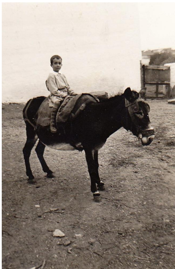
IMAGEM N.º 1 - FOTOGRAFIA DO MEU PAI

Observe-se a referência à fotografia no texto O Menino da Burra :