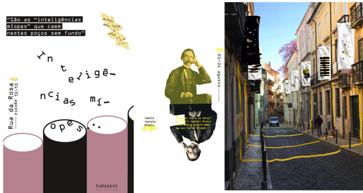
Figura 1- Rua da Rosa, Bairro Alto, Lisboa (AVT - Estudos de Arte e Design, 2020/21. Autoria e Fotografia: Ricardo Almeida & Marco Alpoim).

Apresentam-se três exemplos de projetos de intervenção desenvolvidos na UC de Estudos de Artes e Design pelos estudantes de AVT, no âmbito da proposta “ Se Esta Rua fosse Minha ... ”, para o estudo de um espaço urbano, colocando-o ao serviço da comunidade.