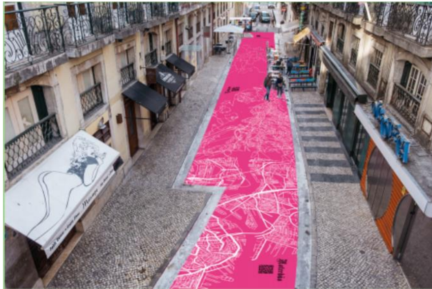
Figura 2- Rua Nova do Carvalho, Cais do Sodré, Lisboa (AVT - Estudos de Arte e Design, 2020/21. Autoria e Fotografia: Ana Cordeiro & Leonor Nunes).

Outros cais/ Cidades Portuárias – foi a problemática identificada pelas estudantes que entenderam assumir como objeto de estudo a Rua Nova do Carvalho, no Cais do Sodré. A partir de uma cartografia do espaço imediato, que cedo as impeliu a cartografias geográficas e humanas mais amplas, propuseram as estudantes uma intervenção de rua à volta do conceito de viagem, construída a partir do levantamento e da representação de mapas das cidades portuárias aludidas pelos nomes dos estabelecimentos públicos que compõem o ambiente urbano (Figura 2). A esta intervenção projetaram as estudantes associar também a construção de um Arquivo de Memória, material e imaterial, alimentado por via de plataforma online e disponibilizado ao cidadão e à comunidade científica, para o desenvolvimento de investigações futuras em áreas que vão da sociologia à história nas suas várias vertentes.