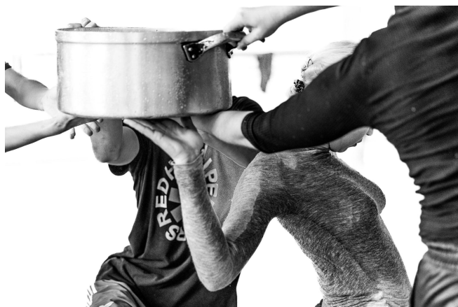
Figura 2 - Exercício proposto em audição sobre o transporte de um recipiente com água.

Assim, a música estrutura o tempo e o ritmo da dança, ressoando emocionalmente com o público. Em Adamastor a montagem musical conta com algumas nuances fulcrais para a peça. O som quase contínuo do mar que remete para as grandes navegações, e também a fluidez do tempo, relembra-nos da água que permeia e gera a vida, e que às vezes termina. A primeira música, "Se essa rua fosse minha" é uma nota pessoal conectando a minha infância e este sentido de pertencer, que uma vez adulto nunca mais o sentirá; e também sobre um amor que toma posse como o de Thetis e Adamastor. A peça já fora encenada com diferentes versões da banda sonora, com pequenos ajustes, até o momento atual onde conseguimos fechar uma versão final.