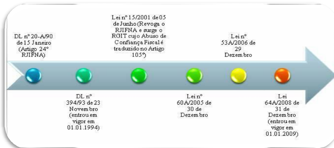
Figura 3.1 Evolução legislativa do Abuso de Confiança Fiscal em Portugal

Este crime desde que nasceu já sofreu diversas modificações de forma que já foi cognominado por vários autores de «crime irrequieto» devido a essas «metamorfoses».