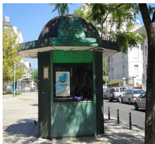
Fig. 11: Quiosque