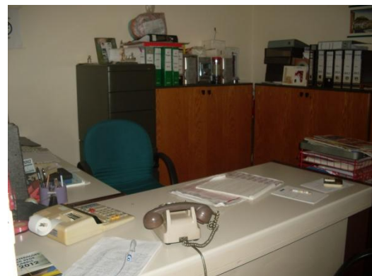
Fig. 7: Gabinete Técnico, Oficinas