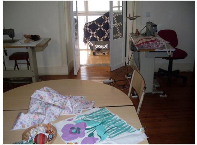
Fig. 5: Sala de Trabalhos