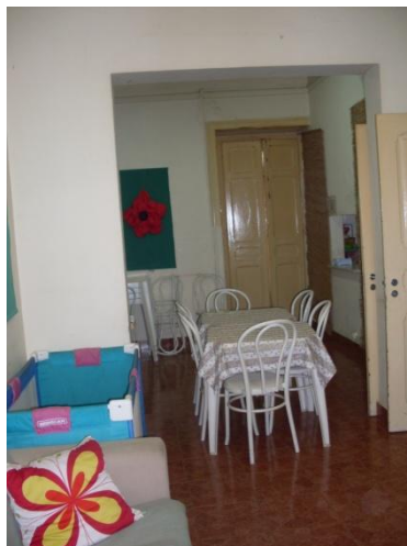
Fig. 2 - Sala de Jantar / Convívio, Lar