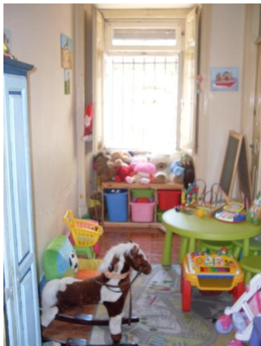
Fig. 1 - Casa dos Brinquedos, Lar