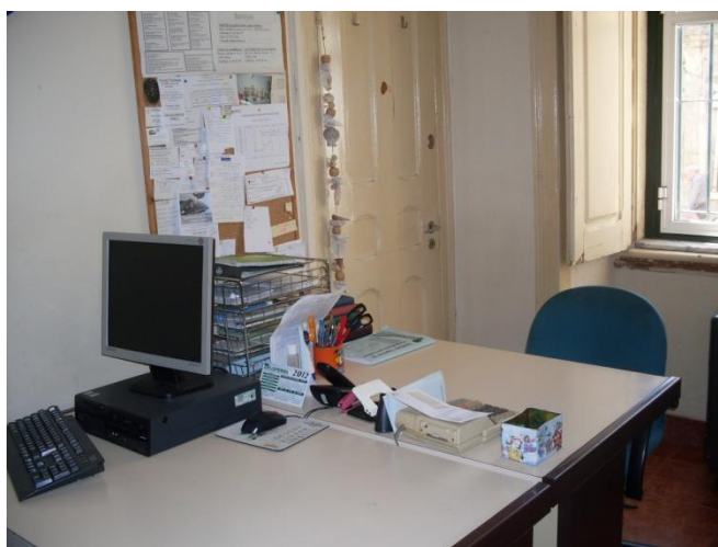
Fig. 3: Gabinete Técnico, Lar