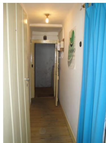
Fig. 9: Espaço Centro de Atendimento