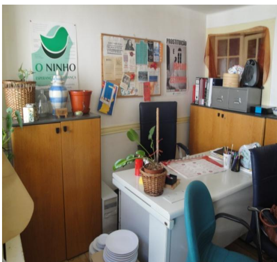
Fig. 8: Gabinete técnico, Centro de Atendimento