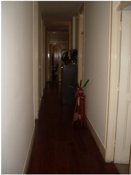
Fig. 4: Espaço Oficinas