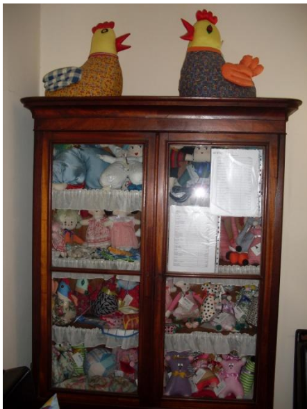
Fig. 6: Expositor do Artesanato, Oficinas