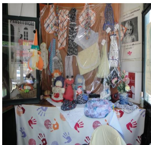
Fig. 10: Peças de artesanato vendidas no Quiosque