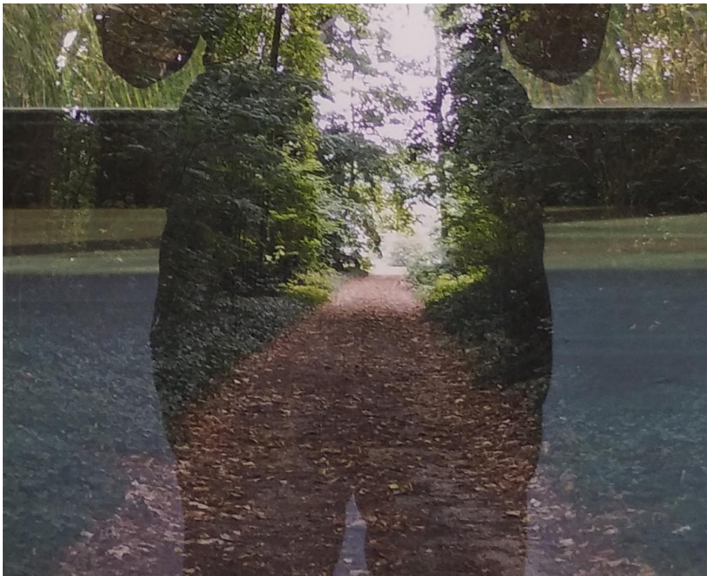
Figura 2 - “Estudar”