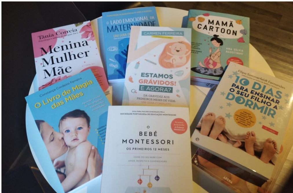
Figura 1 – “Dar à luz”