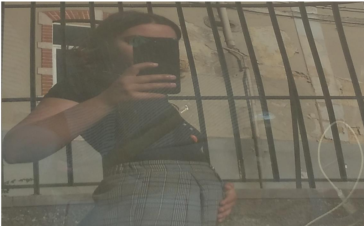
Figura 4 - "Desfrutar"