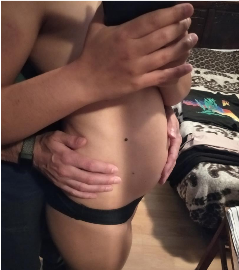
Figura 3 - "Experiência a dois"