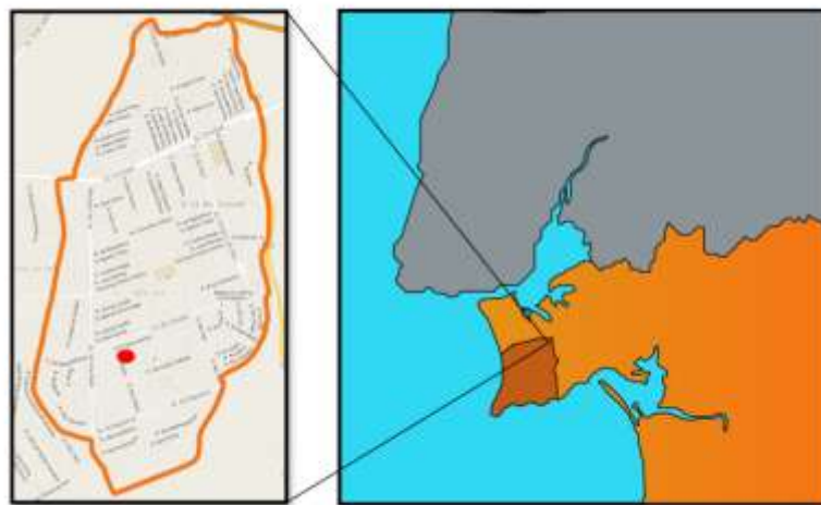
Ilustração 2- Mapa de Localização da Quinta do Conde

Em termos de distribuição etária, a maioria da população tinha entre os 25 e os 65 anos de idade (56,6%). Quanto aos níveis de escolaridade: 19,1% dos residentes