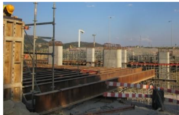
Cimbre ao solo com recurso a salva-taludes.