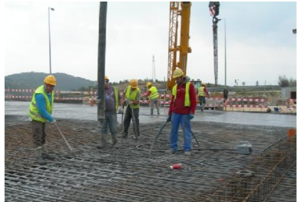
Betonagem do tabuleiro.