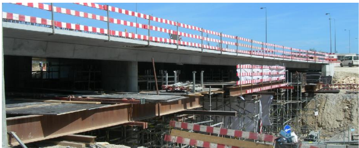
Baixar cofragem do tabuleiro.