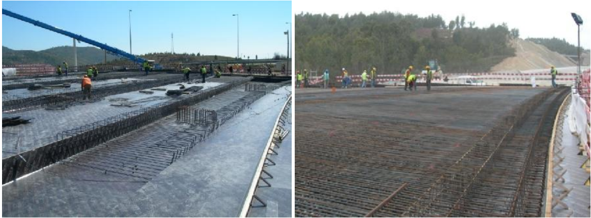
Colocação da armadura do tabuleiro.