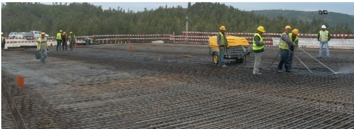
Limpeza do tabuleiro (armaduras e cofragem), antes da betonagem.