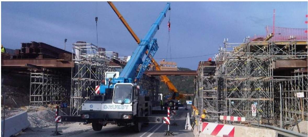
Colocação dos perfis de apoio à cofragem sobre a via rodoviária.