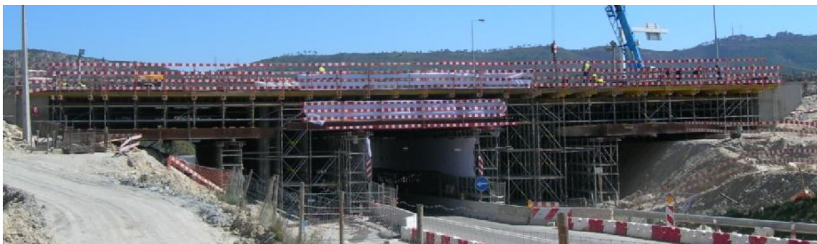
Vista Geral do cimbre ao solo.