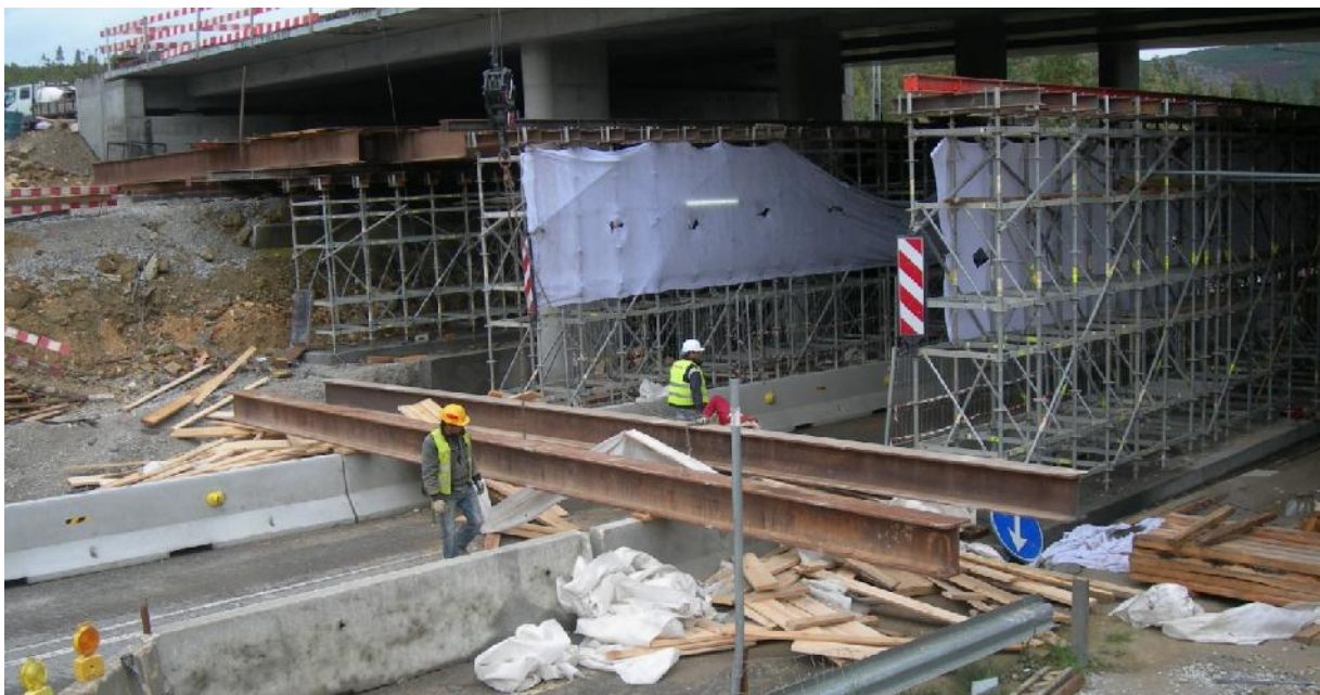
Retirar os perfis de apoio à cofragem entre os dois alinhamentos de pilares.