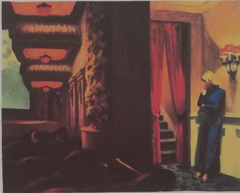
New York Movie | Filme de Nova York Edward Hopper - 1939