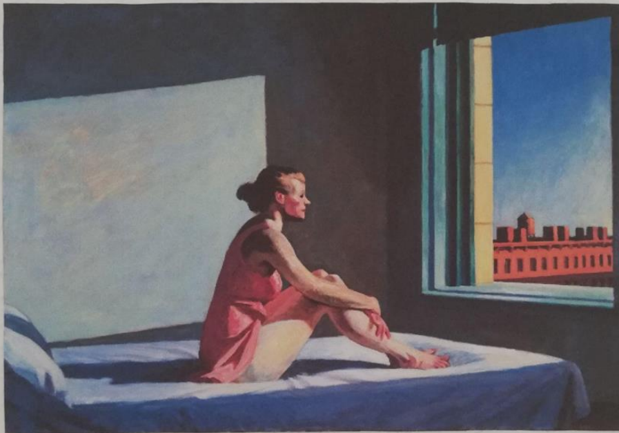
Morning Sun | Sol da manhã Edward Hopper - 1952