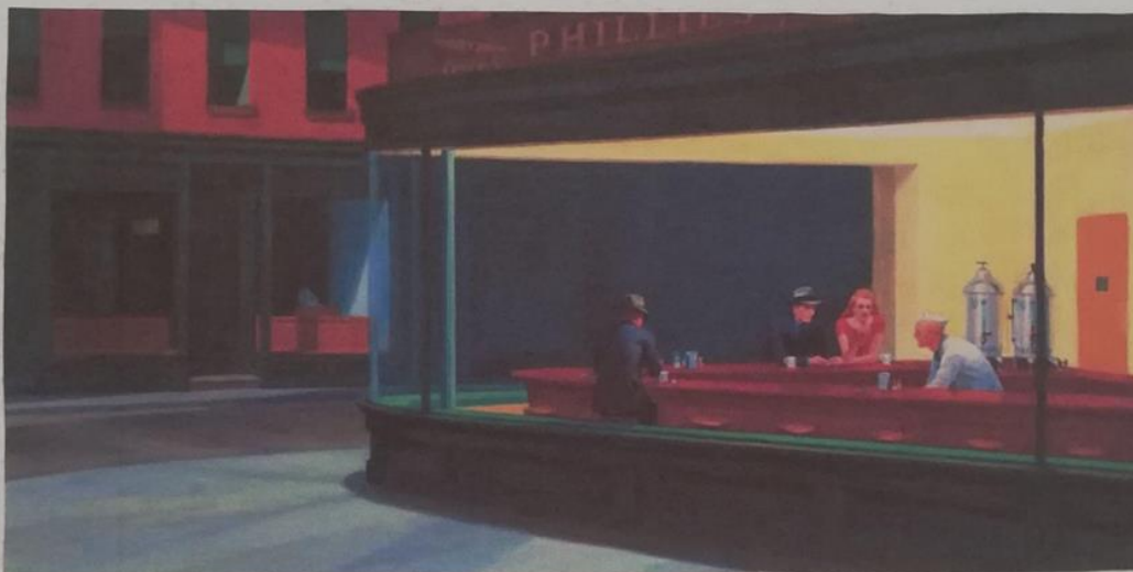
Nighthawks | Falcões noturnos Edward Hopper - 1942