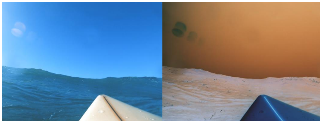
Figura 4 – Ir ao Fundo do Mar e Viver - Elisabete Mendes (2021)

invertidas (o efeito de negativo). A dimensão plástica da imagem sofre alterações, o conceito de destruição expande-se e a sinestesia resulta de um feliz acaso desta montagem.