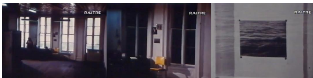
Figura 3 - Wavelength - Michael Snow (1967)

O filme Wavelength (1967), de Michael Snow, é verdadeiramente inovador e minimalista. Todo o filme de 45 minutos, trata-se de um único plano, de câmara fixa, um zoom-in de um estúdio em Nova York, de três paredes, um teto e um chão. O filme começa por mostrar o espaço e tudo o que acontece nele, pessoas que habitam na sala, o vários espaços temporais, dia e noite, o tempo vai passando e vamos percebendo que a câmara está a fazer um zoom-in para o centro da sala. O olhar do espectador ignora tudo o que está à volta concentrando-se no centro da sala. A câmara é o personagem principal neste filme, por vezes até conseguimos pressentir a sua presença através de pequenas hesitações no seu movimento. Cada vez mais a câmara fecha o ângulo, este ângulo diminui até ao ponto em que, em todo o ecrã, temos uma fotografia de ondas que estava pendurada no centro da sala, entre duas janelas. A fotografia está no filme o tempo todo, mas só no final é que conseguimos descodificar o que está dentro desta fotografia.