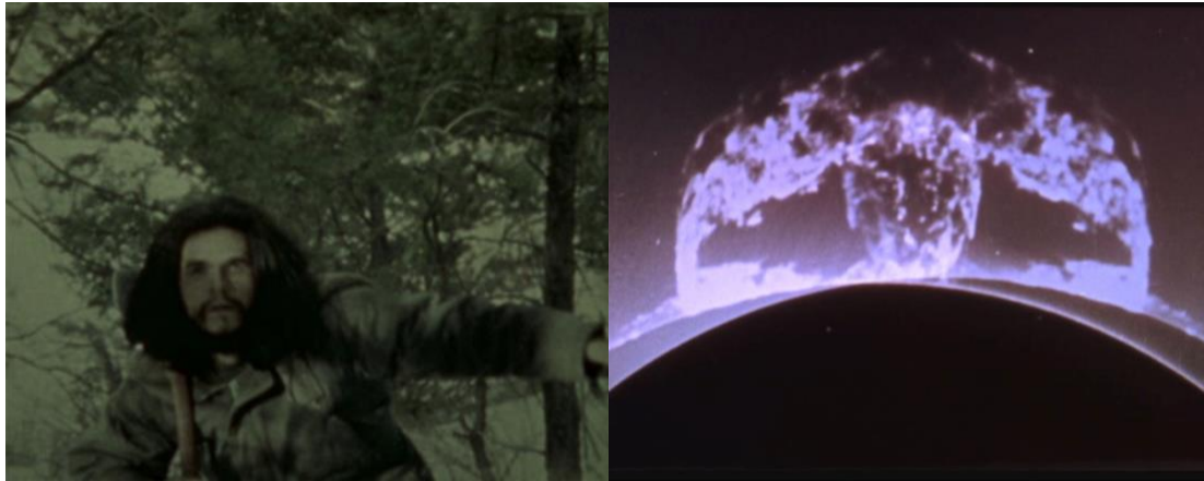
Figura 1 - Dog Star Man - Stan Brakhage (1961 – 1964)

Há um esforço para manter o espectador atento às suas emoções. Esse sentimento está muito presente na nostalgia do desconhecido, nas emoções, nos sonhos, nas palavras não ditas, nos silêncios. É a nostalgia da presença do sentimento oceânico em vez de uma nostalgia que se remete ao passado e à memória. Segundo Youngblood este sentimento oceânico é uma rendição às formas irracionais e confusas da natureza, transmite-nos um sentimento de harmonia interior com as forças responsáveis por estes fenômenos, dissolvem-se as fronteiras que nos separam da natureza, o espectador é incapaz de perceber se as imagens são impressões vindas de fora, ou se vêm de dentro, há um caminho de descoberta da nossa própria criatividade e de que até que ponto a nossa alma participa na criação constante do mundo.