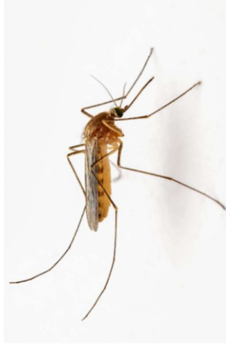
Marcar apenas uma oval.

85. Indica se gostas do mosquito seguindo a escala *