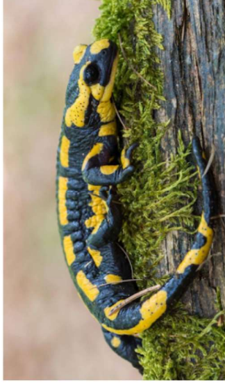
Marcar apenas uma oval.

61. Indica se gostas da salamandra seguindo a escala *