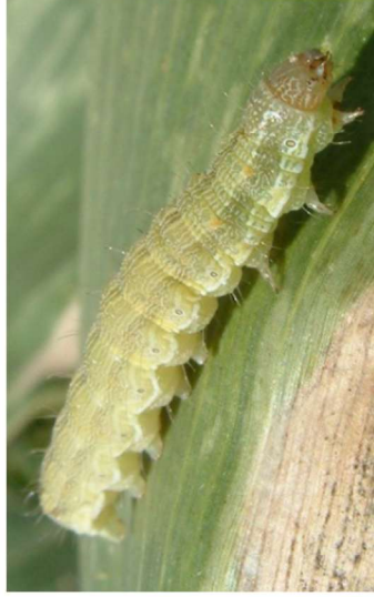
Marcar apenas uma oval.

79. Indica se gostas da lagarta seguindo a escala *