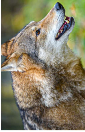
Marcar apenas uma oval.

19. Indica se gostas do lobo seguindo a escala *