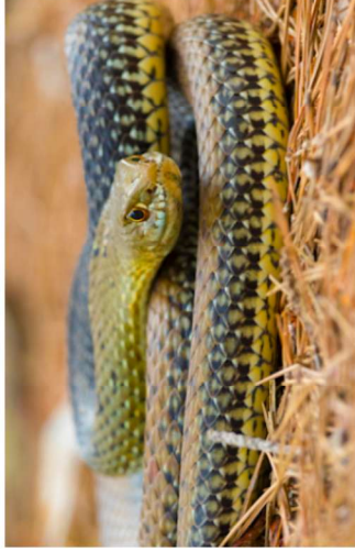
Marcar apenas uma oval.

49. Indica se gostas da cobra rateira seguindo a escala *