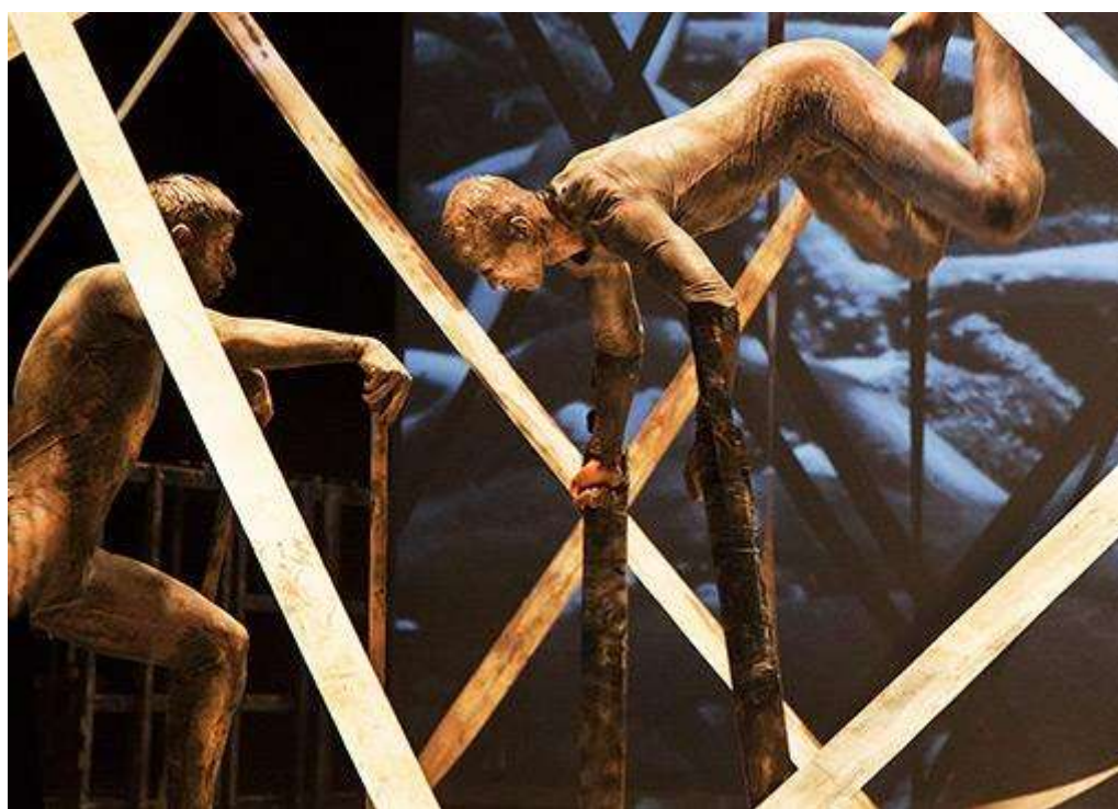
Figura 2: O confronto do cão sem plumas.

Esse corpo do cão sem plumas possui uma modificação em um certo momento do espetáculo. São introduzidos em seus corpos pedaços de madeira que servem para alongar os braços dos bailarinos, o que seriam as patas dianteiras do cão, dando a ilusão de uma grande pata, ou até mesmo uma garra, que eles utilizam para apoiar no chão e se movimentarem pelo espaço (cf Figura 2). Esse momento da obra traz também a ideia de confronto, um corpo contra o outro, usando desse corpo alongado, que parece estar em posição de ataque, para confrontar o outro corpo a sua frente.