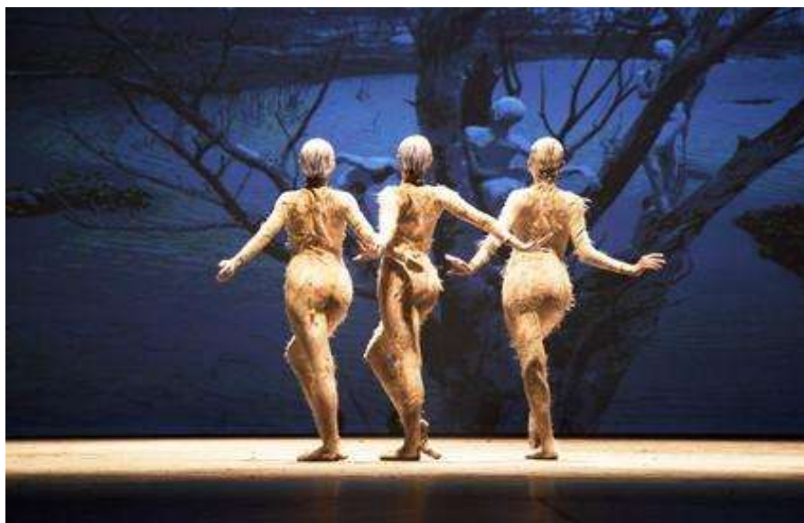
Figura 4: As garças.

A vídeo-instalação Text Rain , outra obra artística, é uma instalação interativa que coloca letras de um poema caindo do topo de uma tela. Através do seu funcionamento, assim que um corpo se coloca à frente da tela, é possível manusear e interagir com essas letras, sendo possível equilibrá-las na silhueta do corpo, ou jogá-las para cima com um movimento. A instalação proporciona essa experiência para quem participa, sendo os corpos dos espectadores importantes integrantes da instalação para que ela aconteça. Afinal, sem eles, as letras continuam a “cair” do topo do ecrã, não realizando nenhum outro tipo de ação. Dessa forma, analisemos os corpos dos participantes. Através do vídeo disponível da instalação, é possível ver diferentes formas com que os corpos se relacionam com as letras, quase como um jogo. É interessante pensar que, por mais que aquelas letras formam um poema, e que os participantes têm a oportunidade de formar palavras ou frases se coletarem letras o suficiente, visualizo que a principal intenção da instalação não seja o conhecimento do público quanto ao poema, como diz Simanowski (2010), e que seja possível lê-lo no meio daquela chuva de letras. Assim, diferentemente de Cão sem plumas e Body and Soul , que utilizam do conteúdo do texto como uma narrativa, em Text Rain , não há intenção de ler o poema, pelo contrário, é a aleatoriedade de criar palavras que possam não estar presentes no poema.