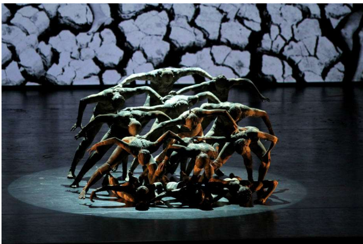
Figura 3: O caranguejão.

Além do corpo do cão sem plumas, corpo individual, Colker introduz um corpo coletivo, que chama de “Caranguejão” (cf Figura 3), na qual todos os bailarinos em cena constroem uma forma, que se movimenta e respira como um só. “Conhecer esse homem-caranguejo, esse caranguejo-homem. É um homem-bicho ou é um bicho-homem?” (Colker, 2019). Esse corpo aparece em diferentes momentos do espetáculo, mesmo que na divisão da obra, há um momento específico e com o seu nome para a apresentação desse corpo. Os corpos que eram únicos e individuais, se transformam rapidamente em um só.