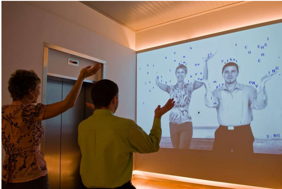
Figura 5: O texto de cada corpo. Retirado de Camille Utterback (2024). ( https://camilleutterback.com/ ).

O corpo, com sua forma, determina e delimita o texto, o quão longo ou quão curto será, assim como seu conteúdo, que pode simplesmente não ter significado ou sentido nenhum, mas é individual a cada corpo que ali se coloca. Dessa forma, temos o texto que se forma através do corpo. Cão sem plumas , em contrapartida, existe através do texto, já que é uma obra coreográfica baseada em um poema. Quero deixar claro que, a partir do momento em que o corpo e o movimento aparecem, o texto se funde a eles, e sobrevive no corpo daqueles em palco, mesmo se o texto em si não está sendo declamado como parte da trilha sonora, o seu conteúdo está presente nos corpos que se formam. Dessa forma, temos o corpo que cria e carrega o texto.