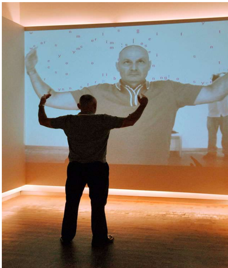
Figura 9: Text Rain de Camille Utterback. Retirado de Camille Utterback (2024). ( https://camilleutterback.com/ ).

forma na obra só é possível por causa do corpo. O corpo faz parte do texto neste caso, ele é o criador das supostas palavras, ele determina o quão longo pode ser, qual a sua forma, e também podemos até visualizar uma individualidade e variedade dos textos que podem ser formados. Cada corpo que ali se coloca vai criar um texto seu, que será diferente da próxima pessoa que se colocar como parte da instalação. Nesse caso, não temos apenas um texto, mas uma multiplicidade de texto que é referente a multiplicidade de corpos que se colocam dispostos a participar da obra. O importante não é saber o conteúdo do texto, se indica ação, se descreve ou cria imagens na nossa cabeça e no nosso corpo. Ao contrário, o nosso corpo cria as imagens para que o texto exista (cf Figura 9).