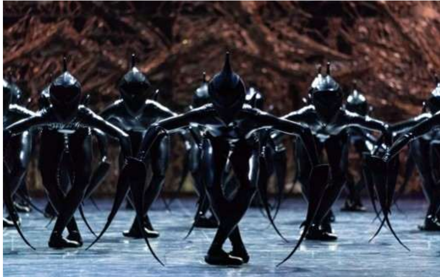
Figura 8: O corpo alienígena de Crystal Pite.

Interessa à coreógrafa como o corpo muda a forma como ouvimos o texto, e a conexão entre a linguagem verbal e o movimento, mas além disso, “(...) depending on how the dancer embodied it [the texts], the meaning changes.” (Pite, C., 2019). Pensemos as palavras no texto não como um material anexo ao movimento, mas como uma extensão do próprio corpo, e nessa existência da palavra no corpo, há a criação de uma imagem (Antunes, 2020, p.164). Para a compreensão do texto como extensão do corpo, é importante falar sobre a verbalização, como já descrito anteriormente, mas não só pensando no ritmo da fala e da acentuação das palavras, mas também “(...) a prosódia que organiza um continuum sonoro de uma língua” (Antunes, 2020, p.165). Dessa forma, o texto acelerado e sussurrado ao início do terceiro ato corroboram para a apresentação desse novo e desconhecido corpo, ao mesmo tempo que nos transporta para um outro lugar, quase como a construção de um novo mundo. São essas questões que transformam as relações que o corpo cria com o texto, o mesmo texto, em momentos diferentes, não só o texto falado como som, mas a manipulação que se pode fazer, concomitantemente ao movimento, para a expressão de uma imagem que se queira passar.