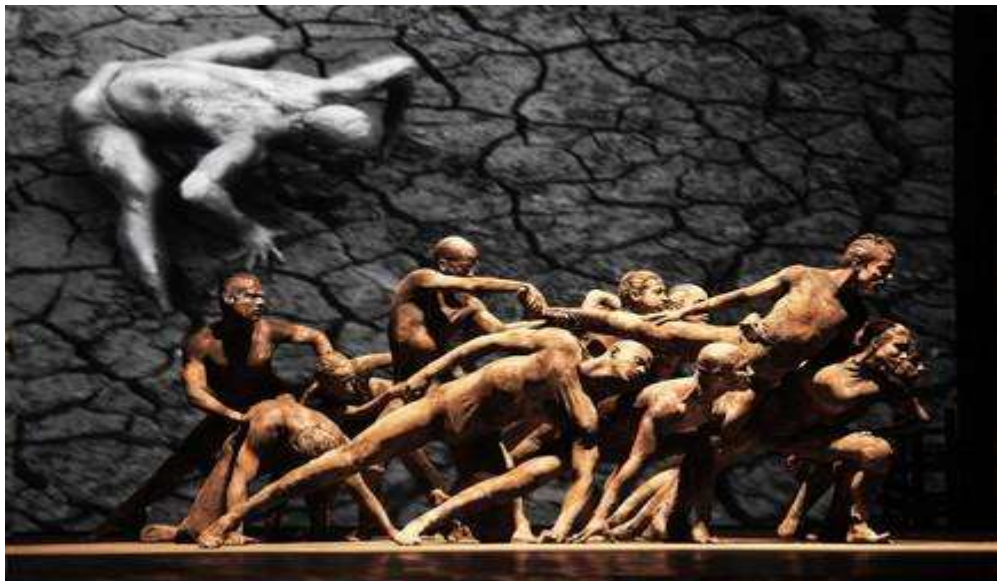
Figura 1: O cão sem plumas. Fotografia de Cafí. Retirada de Companhia de Dança Deborah Colker (2023). ( https://www.ciadeborahcolker.com.br/ ).

“Como o rio aqueles homens são como cães sem plumas (um cão sem plumas é mais que um cão saqueado; é mais que um cão assassinado.” (Neto, 1950, cf Anexo A)