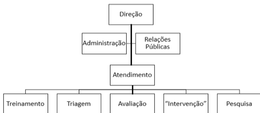
Figura 2. Organograma da estrutura básica dos serviços

fi-cam procedimentos sobre detecção, triagem, avaliação, intervenção, divulgação, participação dos pais e voluntários, treinamento de pessoal e realização de pesquisas”(Pérez-Ramos, & Pérez-Ramos,1996, p.108). Dessa forma, a estrutura básica de funcionamento dos serviços de estimulação precoce seguiria o modelo apresentado na Figura 1, onde a Administração e Relações públicas representam as unidades de apoio vinculadas à direção e Treinamento, Triagem, Avaliação, Intervenção e Pesquisa constituem as unidades de operação, onde o atendimento é feito, de facto.