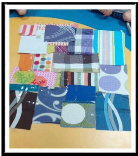
Figura 1: Planeamento da construção da manta

A manta das histórias tinha como objetivos iniciais i) apelar à responsabilização, por parte das crianças, em relação aos livros; ii) despertar o gosto e curiosidade pela leitura e proporcionar atividades diversificadas e iii) estimulantes que potenciassem o desenvolvimento de competências nas crianças. Inicialmente a manta existia apenas como um material, uma forma de introduzir de forma criativa e estruturada as atividades. Mas, ao longo da PPS, as crianças demonstraram interesse em construir a sua própria manta – manta da sala – para que eles pudessem também partilhar objetos ou histórias com os seus pares. Dessa forma, no mês final da PPS iniciamos a construção da manta da sala.