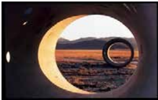
Imagen 5: Autor: Nancy Holt. Obra: Sun Tunnels. 1973-1976.