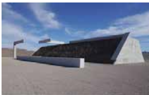
Imagen 1: Autor: Michael Heizer. Obra: City: Complex One, 1972–74.

Los primeros artistas que empezaron a trabajar el paisaje fueron Michael Heizer, Robert Smithson, Robert Morris, Dennis Oppenheim, Walter de María o Nancy Holt.