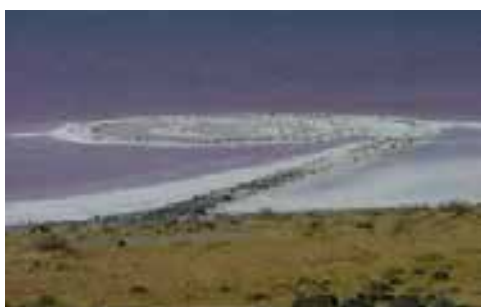
Imagen 2: Autor: Robert Smithson. Obra: Spiral Jetty, 1970.