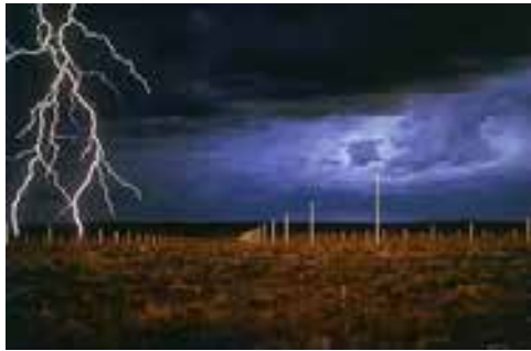
Imagen 4: Autor: Walter de María: Obra: Campo de relámpagos.1977.