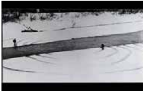
Imagen 3: Autor: Dennis Oppenheim. Obra: Annual rings, 1968.