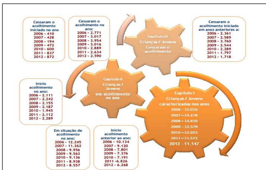
Figura 1 – Dados comparativos de crianças e jovens em situação de acolhimento, entre 2006 e 2012

De acordo com o CASA 2012 , a institucionalização de crianças e jovens tem vindo a diminuir desde 2006, como apresenta a tabela seguinte: