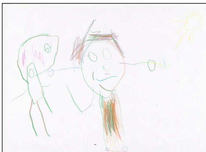
Imagem 3 – Desenho Nody (4 anos)

Foi visível nas várias visitas ao centro de acolhimento que as crianças deambulam pela casa, que a consideram como sua.