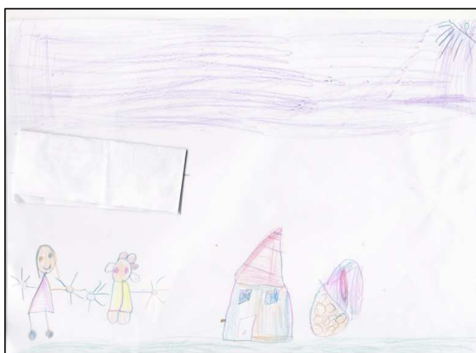
Imagem 1 – Desenho Ana Gomes (7 anos)

“Cláudia [Investigadora] – O que fizeste no teu desenho?