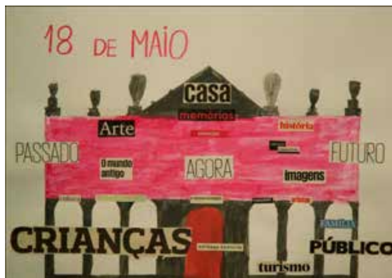
Um dos cartazes feitos pelas crianças para divulgarem o Dia Internacional dos Museus