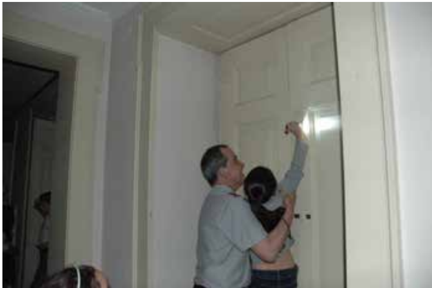
As crianças acompanham o segurança na "Ronda da noite", após o encerramento do museu

Por extensão, e não menos importante, foi o impacto que o projeto teve nas famílias e amigos dos participantes. O projeto envolveu as famílias que acabaram por também vivenciar o espírito do clube e trouxe-as ao museu com regularidade para ver o resultado das atividades das crianças. Os familiares dos Carrancas também foram, por extensão, habitantes deste museu e certamente ficaram mais despertos para as potencialidades que os museus têm em termos educativos.