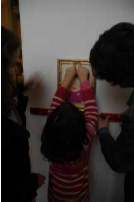
A equipa técnica explica como se pendura uma obra de arte

Também considero importante mencionar o envolvimento dos funcionários do museu, em particular dos vigilantes e da equipa técnica, que conviveram e estabeleceram laços com os pequenos habitantes cuja presença ao sábado se tornou num fator de animação e de curiosidade. Para além disso, há que referir que a colaboração da equipa técnica foi mesmo imprescindível para a concretização de algumas atividades do clube, como por exemplo a montagem da exposição no átrio de entrada do museu onde as crianças expuseram os seus autorretratos – primeira atividade realizada pelo Clube dos Carrancas em 2012.