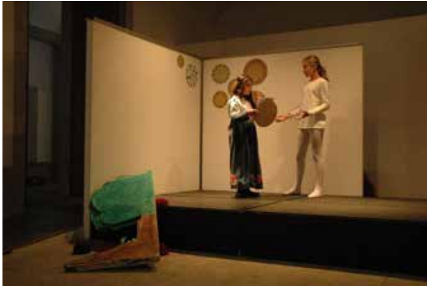
Um dos ensaios finais