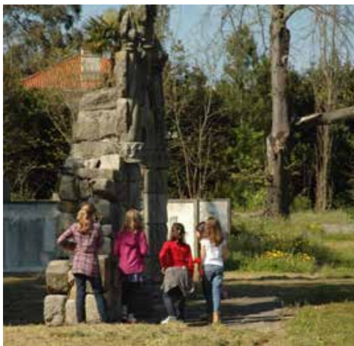
Um jogo na Cerca do MNSR

Para isso, foi preciso trazer para o museu as atividades que normalmente as crianças fazem em suas casas: brincar, festejar, comer, convidar amigos, dormir, etc. Nesta fase, o papel do mediador é o de proporcionar a aproximação ao espaço, às pessoas que lá trabalham e à própria dinâmica da instituição museológica. Nesse sentido, cabe-lhe a definição de estratégias e atividades a realizar, de acordo com o grupo, com o perfil de cada criança e os seus interesses.