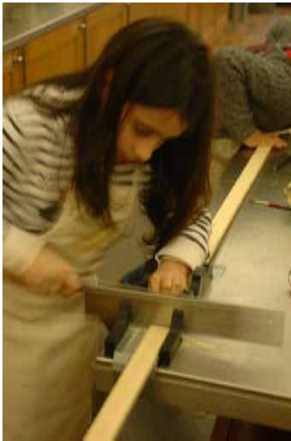
A realização dos cenários

A peça de teatro foi apresentada ao público no dia internacional dos museus, em 18 de Maio de 2014 e integrada na oferta do museu para esse dia que nesse ano tinha como tema “As Coleções geram conexões”. A apresentação encerrou um ano de trabalho, dedicação e divertimento.