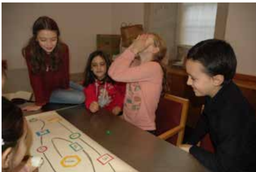
Jogo de perguntas e respostas entre amigos