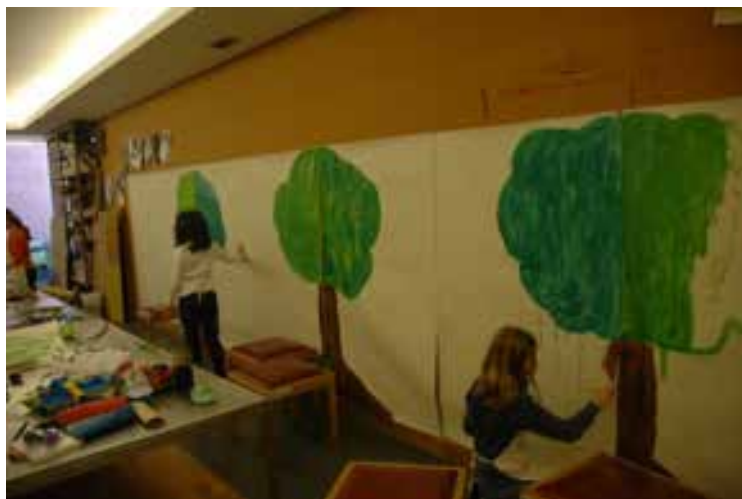
A realização dos cenários