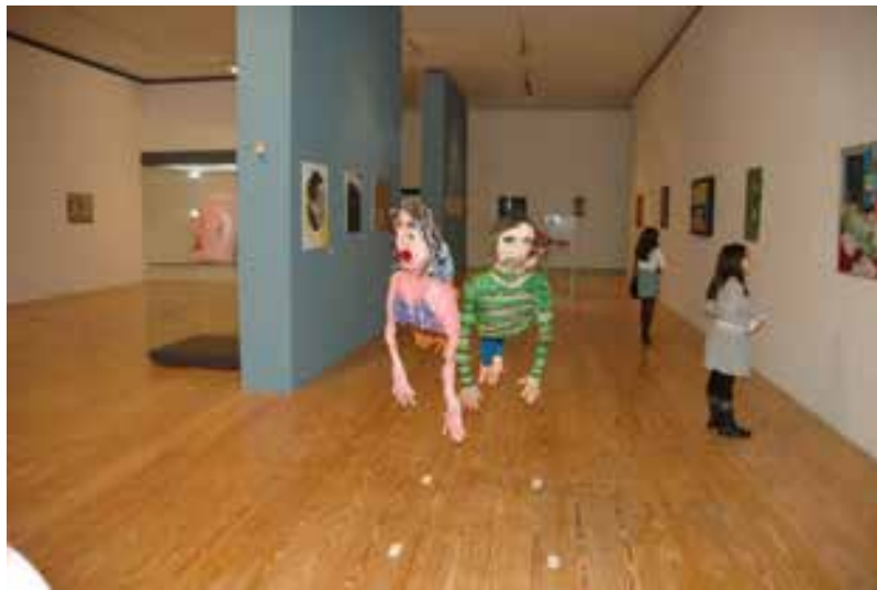
O Clube dos Carrancas numa exposição temporária