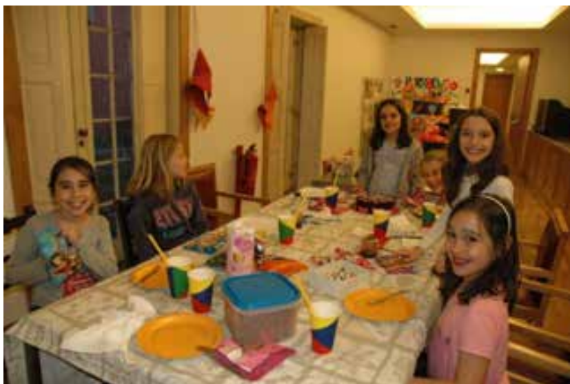
Lanche de aniversário