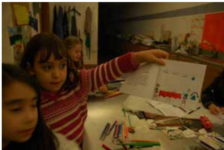
A ilustração do livro

Quando o livro ficou pronto, depressa uma das crianças lançou uma nova ideia: “era giro fazermos uma peça de teatro a partir desta história!”. Após muitas negociações e cedências, a peça de teatro impôs-se como o próximo desafio dos membros do clube.