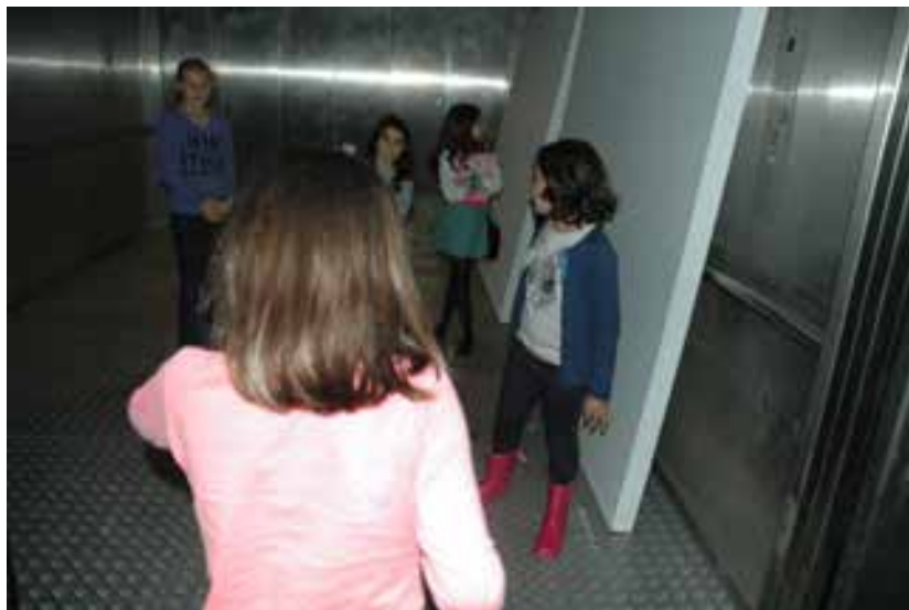
As crianças quiseram conhecer os bastidores do museu: o Clube dos Carrancas no montacargas