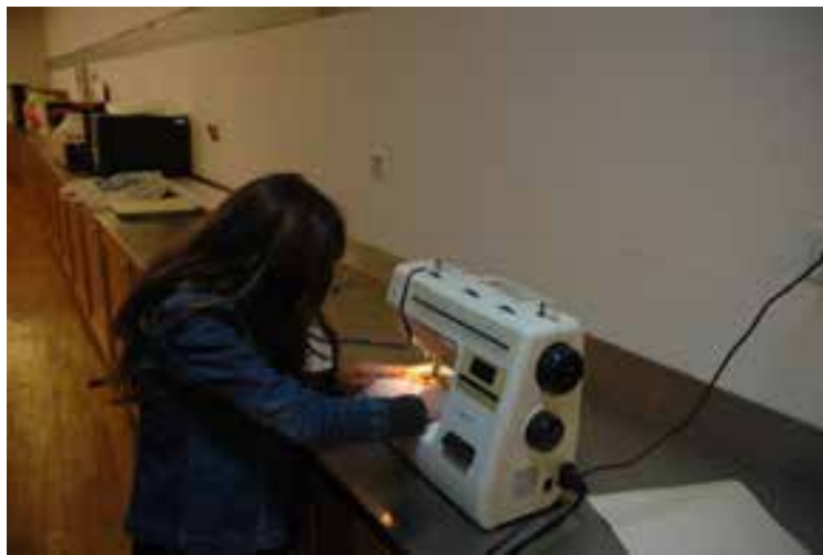
A realização do guarda-roupa

A concretização desta ideia proporcionou um envolvimento maior dos participantes com as coleções do museu, um envolvimento que os próprios participantes demonstraram vontade de ter. As peças que outrora foram personagens de um conto tinham agora que ganhar forma e conteúdo e, para isso, tiveram que ser estudadas para uma caracterização mais profunda dos seus estados de espírito, dos seus problemas, para a redação dos diálogos e a execução do guarda-roupa, adereços e cenários. Todas essas tarefas foram decididas e executadas pelos participantes, ao longo de vários meses.