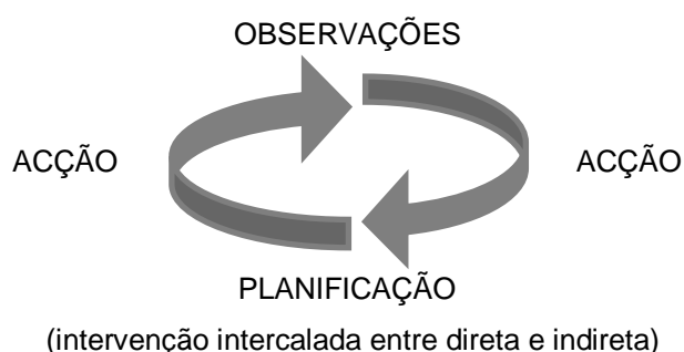
Figura 1: Ciclo reflexivo da metodologia Investigação-ação

Distinguem-se três modalidades de realização da metodologia investigação-ação, estabelecidas para responder às diferentes intenções de pesquisa (Sousa & Baptista, 2011): (1) Investigação-ação técnica; (2) Investigação-ação prática; (3) Investigação-ação crítica ou emancipadora. Foi premissa do Estágio aqui tratado, que o investigador se assumisse como condutor principal do processo de investigação, sendo ele o responsável pelo plano de ação. Neste sentido, a metodologia de investigação prática foi a modalidade mais condizente, por garantir primazia e autonomia de atuação ao professor/pesquisador. (Sousa