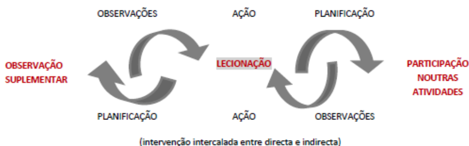
Figura 3: Ciclo reflexivo da fórmula de Estágio

Apesar da alteração formal procedida, a garantia destas e doutras outras ações educativas decorridas no estágio, promoveu a verosimilidade necessária ao método adotado para a investigação.