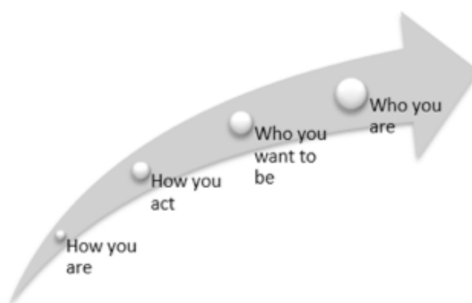
Figura 2 – Do Como ao Quem – Ilustração do desenvolvimento pessoal e profissional de Práticas Reflexivas - Cunningham (2016)

Processo Transformativo do Como ao Quem. Segundo Cunningham (2016) trata-se de um processo sofisticado que permite acompanhar o desenvolvimento pessoal e profissional dos participantes em estudo, através de uma linha orientadora de 4 fases, que se inicia com o aumento da autoconsciência (fase 1 – Como Eu Sou); passa pela compreensão dos seus comportamentos quando aplicam estratégias de autorreflexão, ou seja, as suas atitudes (fase 2 – Como Ajo); que vai da compreensão do ponto de vista pessoal à compreensão das necessidades pessoais, havendo um conhecimento sólido de quem se é enquanto profissional e as estratégias de que se necessita para trabalhar em função do profissional que se pretende ser (fase 3 – Quem Quero Ser), e culmina na fase em que já se modela e promovem as práticas reflexivas com pares, dedicando um tempo diário para o efeito (fase 4 – Quem Eu Sou). Trata-se no final de uma nova presença profissional.