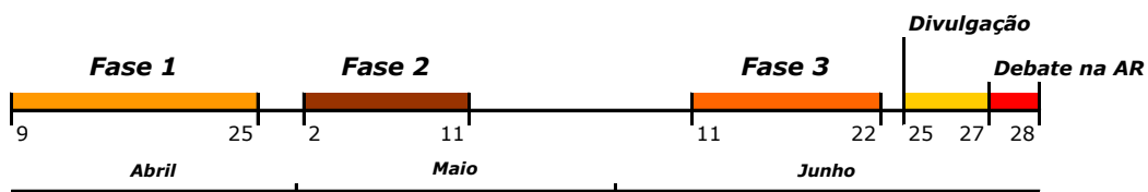
Figura 1. Cronograma das fases de recolha de informação

É apresentado, na Figura 1, o cronograma das fases de recolha de informação.