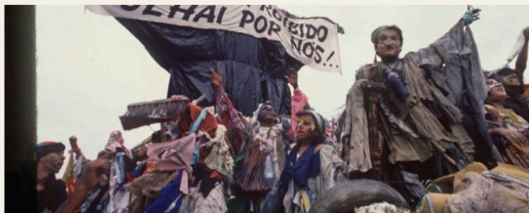
Detalhe de carro alegórico do desfile realizado pela Escola de Samba Beija-Flor. Rio de Janeiro – 1989 – Ratos e Urubus larguem a mimha fantasia.

Imagem retirada da apresentação da sinopse do projeto em formato PowerPoint.