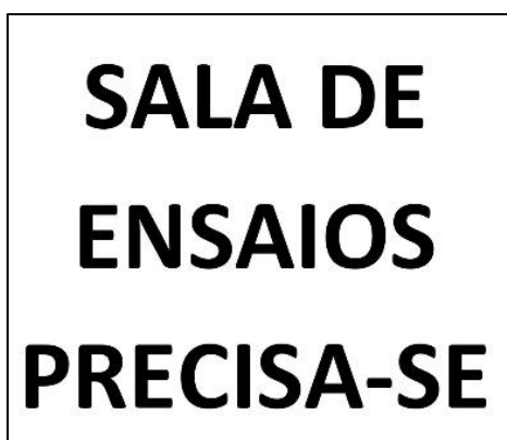
Figura 1 – Cartaz a reivindicar um espaço

Há um episódio, que pensamos ter tido influência na cedência do espaço ao grupo. No dia 25 de Abril de 2009, na manifestação havida em Pinhal Novo, todos os elementos do grupo marcaram presença. Após os discursos oficiais, e na presença de todos, em frente ao espaço que o grupo reivindicava, os indivíduos da Acção Teatral Artimanha exibiram cartazes com este alerta: