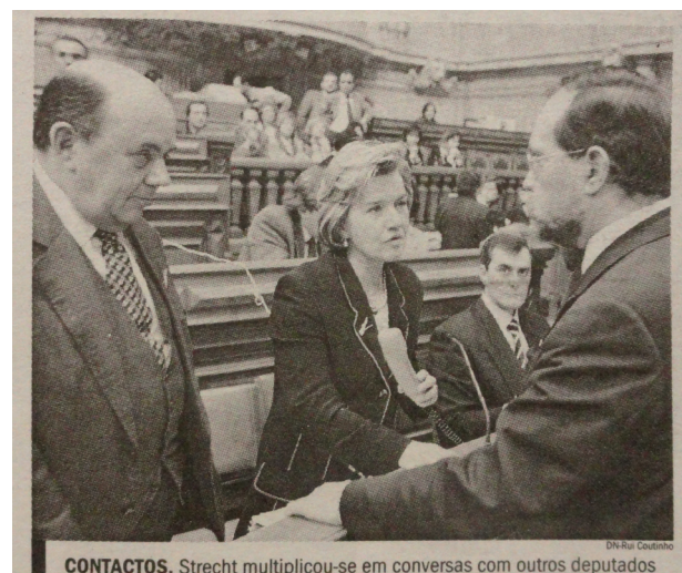
Figure 1 : Diário de Notícias, 21 février 1997

Analyser, dans les images, ce que Kress et Van Leeuwen (2006) appellent des structures narratives équivaut, en substance, à analyser les modes de composition, c'est-à-dire, les différents éléments représentés sur l'image, leurs relations internes et leur distribution dans le cadre, décrivant la composition en termes de masses, la distribution des masses sur la surface du cadre, les poids relatifs, les tensions, les lignes de lecture, etc. (Arnheim, 1993). Cette analyse permet de cerner le discours imagétique, notamment les histoires rapportées, les relations d'importance entre les actions et le/s protagoniste/s, les modes de présentation des actions (les vecteurs, la transitivité ou non-transitivité des actions représentées), ainsi que certaines relations de pouvoir entre les personnages représentés. Ces critères permettent aussi de comparer la représentation assignée aux hommes et aux femmes. Dans le contexte journalistique, la présence de légendes et titres nous permet de mieux comprendre la construction du sens par l'ancrage ou la complémentarité avec l'image 29 . Cette relation image/texte est très importante pour mieux déterminer les points de vue journalistiques, notamment la détermination des sujets de l'action et les sens particuliers investis dans les images. Elle est fondamentale pour l'analyse des modes de représentation des genres.