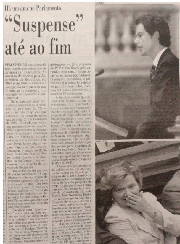
Figure 2 : Público, 4 février 1998