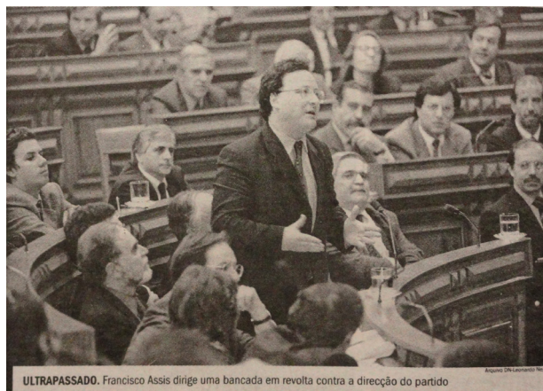
Figure 6 : Diário de Notícias , 7 février 1998

Les valeurs de l'action, de la confrontation, de la détermination, de la solidarité de groupe sont pour la plupart absentes des images et des textes représentant les femmes parlementaires. Sur l'image 6, Francisco Assis, le chef du groupe parlementaire socialiste en 1998, s'adresse à la Chambre dans une image typique de la représentation masculine : debout parmi ses partisans, avec des gestes de certitude et démontrant la confiance, en face de ses adversaires (même s'ils sont hors-champ) et représenté comme un égal, toujours en train de parler ou agir. Une image comme celle d'Assis est absente de notre corpus de 300 photographies quand il s'agit de représenter les interventions des femmes députées au Parlement dans le cas de l'IVG.