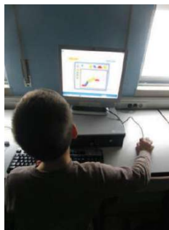
Figura 3. Resolução de tarefas através da applet

A homogeneidade dos grupos foi atestada através da análise à normalidade da amostra, assim como recorrendo ao teste de hipóteses adequado: Shapiro-wilk e o teste U de Mann-Whitney .