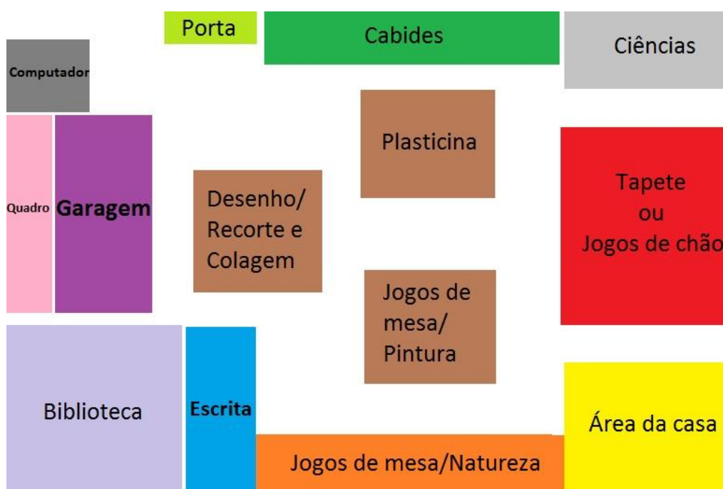
Figura C 2 - Planta da sala de atividades de JI