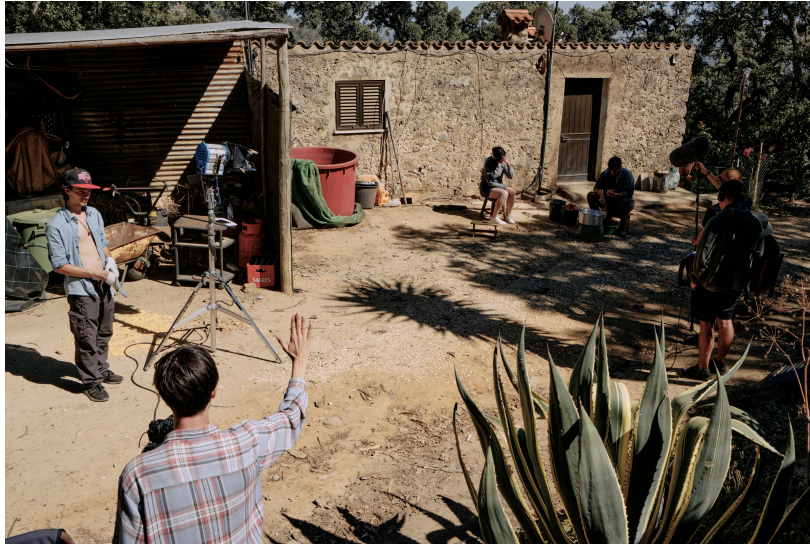
Filmagem da cena

têm estas motivações e falam desta maneira e o plano terá o tempo necessário para as enquadrar.