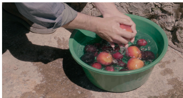
Exemplo plano aproximado 1

O peso do espaço e da natureza, o vazio do lugar, mas também da grande distância que sentimos das personagens (a aproximação que temos delas é lenta) e a distância que as personagens sentem entre si. Por exemplo, a distância que a protagonista sente da mãe e da irmã ou total desligamento que estas têm em relação ao caseiro. Imagino a tendência para corpos inteiros e para corpos longínquos, tendencialmente com uma leitura de expressões faciais limitada. Contudo, em momentos de diálogo, em momentos mais íntimos ou de detalhe, haverá a necessidade de aproximar a câmara, de modo a ser possível captar o que é importante na cena.