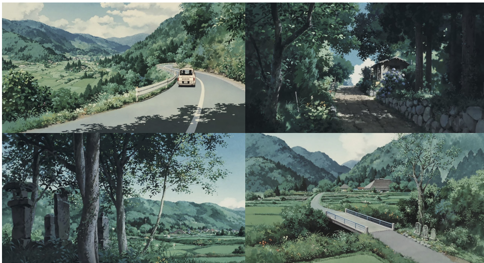
Frames de Only Yesterday (1991) - dir. Isao Takahata

Vejo no exemplo destes frames o grande peso da natureza e a presença humana colocada em segundo plano. Esta referência é mencionada no sentido de partilhar uma primeira inspiração.