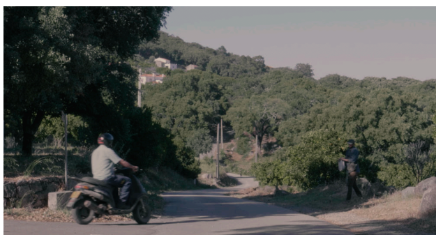
Exemplo plano profundidade

Dentro do mesmo pensamento, é igualmente relevante falar da profundidade, visto que há a tendência nas ações para personagens irem e virem, aproximarem-se e afastarem-se, passarem de um sítio para outro, na vastidão do lugar. Esta ideia de movimentação tanto poderá ser feita a partir da imagem como através do som.