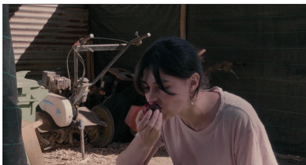
Exemplo plano aproximado 2

Quando anteriormente mencionei a questão do formalismo, referia-me a composições que têm em conta as linhas (horizontais, verticais, diagonais), a simetria e o equilíbrio na composição. Interessam-me planos que não servem apenas para seguir as ações das personagens.