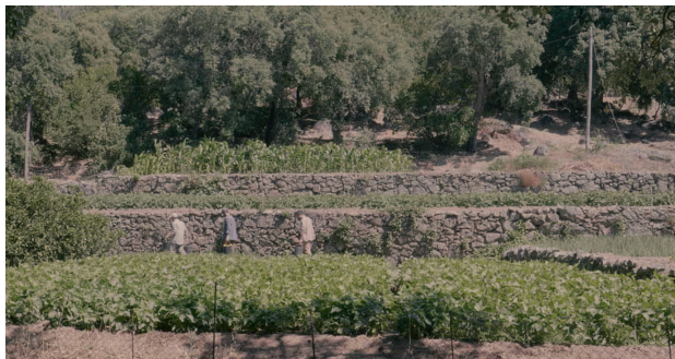
Exemplo plano luz 1

Estes exemplos mostram dois locais adjacentes, capturados de duas maneiras diferentes.