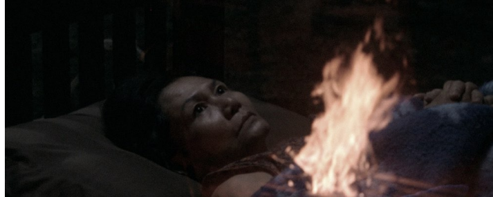
Frame de Blue (2018) - dir. Apichatpong Weerasethakul

de laranja e a cama azul e fria em que uma mulher dorme. Uma sobreposição visual, neste caso, mas que acredito que ajuda a esclarecer o que estou a propor.