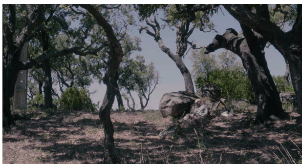
Exemplo plano luz 2