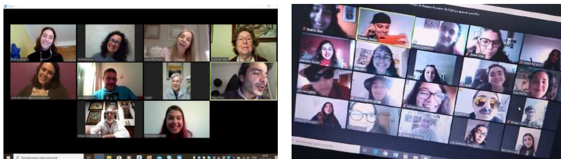
Figura 2. Novos tempos, novos palcos – Ensaios dos grupos referidos via plataformas virtuais.

O projeto de formação e(m) Teatro Comunitário da Boutique da Cultura 8 (Carnide, Lisboa) começou a esboçar-se há dois anos e, à data do início do estado de emergência, tinha já dois espetáculos criados de raiz, apresentados ao público, e preparava-se para estrear o terceiro espetáculo; o projeto do Coletivo A Tribo 9 (Mafra) vai já no seu sexto ano de existência, contando com mais de uma dúzia de criações no âmbito do Teatro Comunitário e estreou recentemente um espetáculo online. Fizemos uma breve recolha de testemunhos sobre a importância das plataformas virtuais na continuidade dos encontros entre participantes e dinamizadores destes projetos (figura 2).