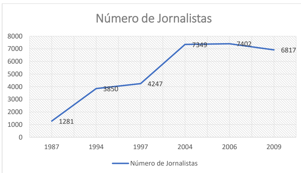
Gráfico 1. - Jornalistas em Atividade (1987-2009)