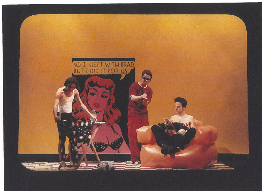
6. e 7. Espetáculo Pêssegos , encenação de José Wallenstein. Lisboa: Teatro Aberto, 1997.

Noren, no Teatro da Cornucópia, 1997 (il. 5); Pêssegos , de Nick Grosso, no Teatro Aberto, 1997 (ils. 6 e 7); E No Intervalo Faz-se Qualquer Coisa , sendo também sua a coautoria de dramaturgia, para o Teatro da Cornucópia, integrado no Festival dos 100 Dias, no âmbito da EXPO 98; A Metamorfose , de Franz Kafka, para o Grupo Visões Úteis, no Auditório Nacional Carlos Alberto no Porto, 1998; Só para Iniciados , baseado em Pinóquio de Carlo Collodi, para a Companhia Paulo Ribeiro, apresentado no Teatro Viriato, em Viseu, e no Centro Cultural de Belém, 1999. Viria ainda a colaborar com este encenador em vários espetáculos de Ópera, supramencionados.