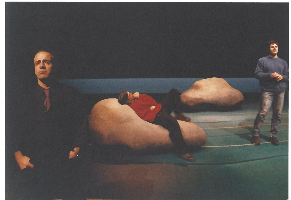
1. e 2. Espetáculo Água Salgada , encenação de João Lourenço. Lisboa: Teatro Aberto, 1997.