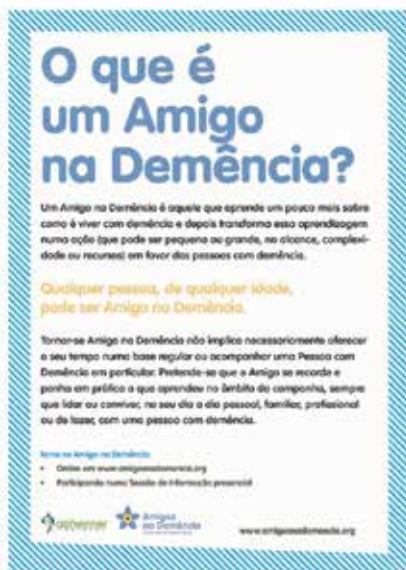
Exemplo de Poster disponível na Área de Embaixador no Website