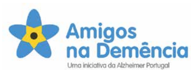
Logotipo da Campanha Amigos na Demência

Em Portugal, a Campanha Dementia Friends foi lançada com o nome “Amigos na Demência, mantendo as cores e modelo de intervenção da campanha no Reino Unido.