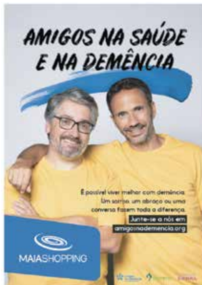
Cartazes Campanha Amigos na Saúde e na Demência