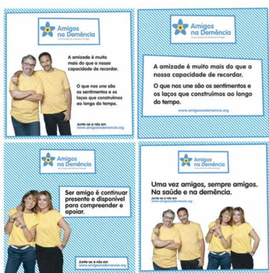
Exemplos de Posts nas Redes Sociais da Alzheimer Portugal

O arranque desta campanha ficou marcado com o lançamento de vários vídeos onde é possível ouvir testemunhos de amigos de pessoas com esta doença, onde se torna evidente que a amizade é o que prevalece em todos os momentos. Aos “Amigos na Saúde e na Demência” juntam-se ainda várias caras conhecidas.