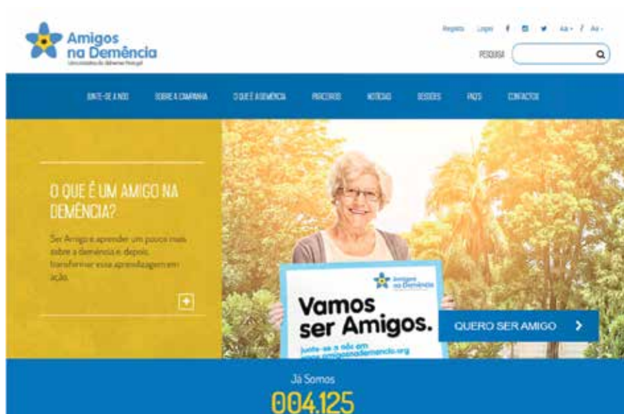
Homepage do website www.amigosnademencia.org

A Alzheimer Portugal concebeu e criou um website integralmente dedicado à Campanha Amigos na Demência, incluindo um contador do número de Amigos na Demência.