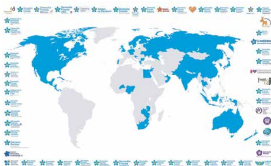
Campanha Amigos na Demência em dezembro de 2019