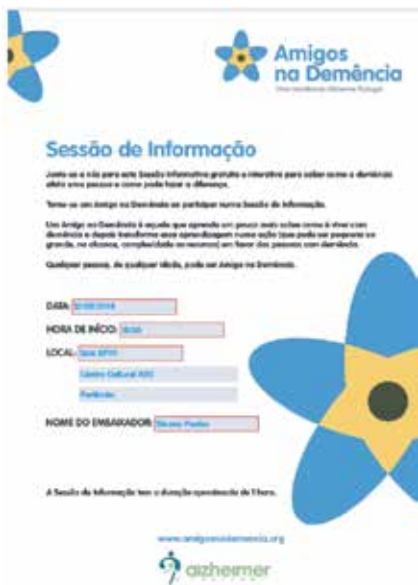
Modelo de Cartaz adaptável para Embaixadores