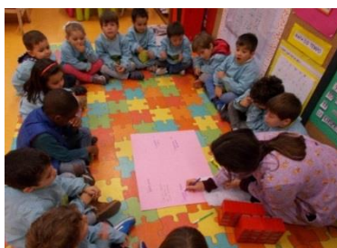
Figura 2 – Discussão em grande grupo sobre o que é Ser Amigo ?

despertasse nas crianças a importância de “ter amigos”. Complementarmente, recorri, ainda, à criação de jogos (cf. NC 232 na p. 126 e NC 292 na p. 144 do Anexo A) e à realização de entrevistas para conhecer a rede de amizades existentes no grupo e as concepções das crianças sobre esta questão (Cf. p. 308 do PJI). Segundo Sarmento, citado por Richter, Bassani e Vaz (2015), “o educador de infância deve ser capaz de permitir que a criança brinque e deve garantir condições de brincadeira às crianças, ampliando essas brincadeiras” (p. 31) para garantir experiências ricas, diversificadas e sociais às mesmas.