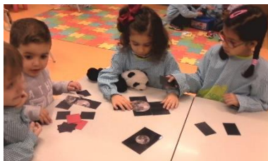
Figura 5 – Crianças a fazer puzzles em conjunto

O Catboy, o Spyderman, o Transformer e o Mickey estiveram a jogar o jogo da lua. Conforme jogavam o dado, andavam com a sua peça o número que lhes tinha saído e respondiam às questões, tal como eu tinha jogado com eles inicialmente.