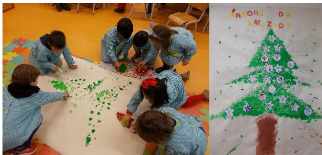
Figura 3 – Realização da Árvore da Amizade

305 do PJI). Pessoalmente, fiquei muito orgulhosa com o resultado final, uma vez que foram as próprias que elaboraram, pintaram e colaram (cf. Fig. 3). Ademais, considero que as experiências são mais significativas quando as crianças participam ativamente na sua elaboração.