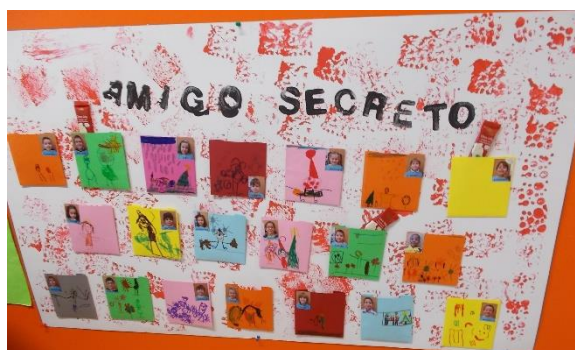
Figura 4 – Pannel do Amigo Secreto , realizado com as crianças

Por último, jogámos ao amigo secreto na semana anterior ao Natal (cf. Fig. 4). Cada criança tinha um amigo secreto e deveria colocar qualquer coisa na caixinha do seu/sua amigo/a sem que o/a mesmo/a se apercebesse. Foi uma dinâmica aliciante. Porém, por motivos que me ultrapassaram, não foi concretizada da forma que havia planeado. Por esse motivo, penso que não teve impacto em todas as crianças (Cf. p. 318 do PJI).