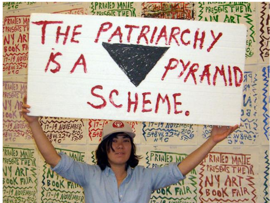
Imagem1: "More Real than reality itself", A.L. Steiner. 2014