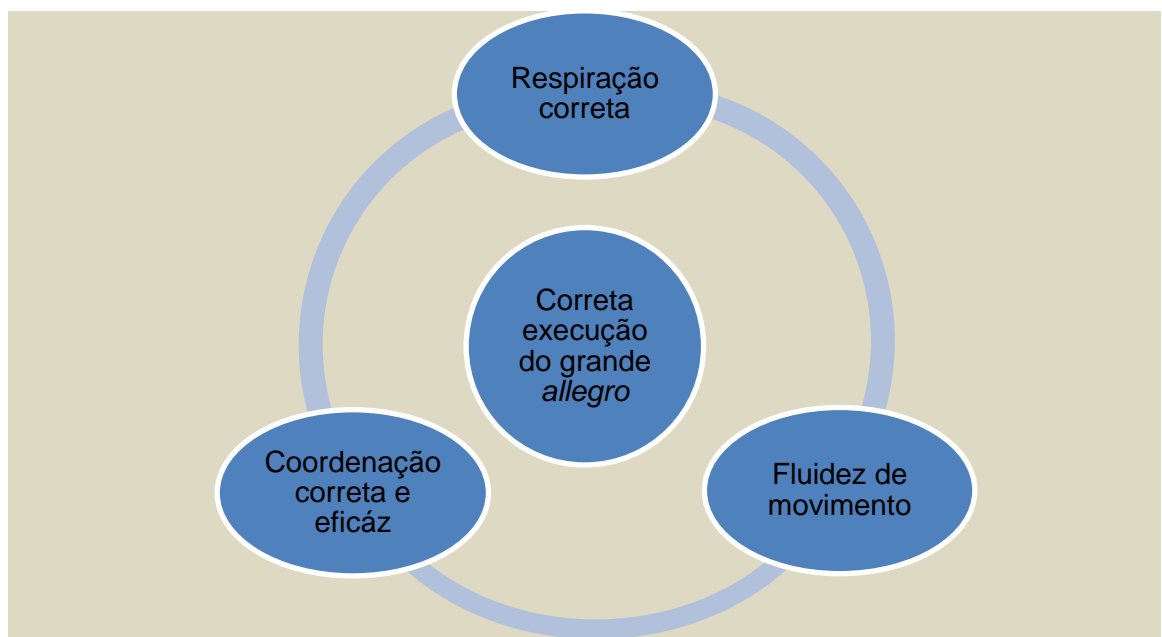
Figura 3: Interligações entre diversos itens responsáveis pela execução do grande allegro

Apresentamos de seguida um quadro que ilustra as interligações entre diversos itens que consideramos responsáveis por uma boa execução do grande allegro :