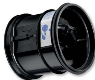
SÓ PODE SER INSTALADO NO INTERIOR DE CONDUTAS COM DIÂMETROS NORMALIZADOS

Dimensionamento - de acordo com o tamanho da conduta (normalizado).