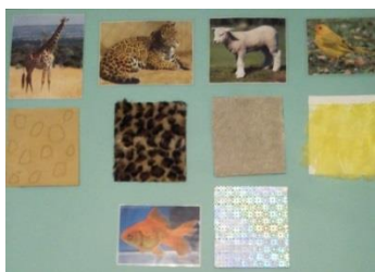
Figura 3 – História sensorial

A exploração da história “Tal como tu”, aborda as diferentes partes do corpo e os animais. Partimos então deste ponto para completarmos, com imagens dos órgãos dos sentidos (ver anexo III – figura 21) e rimas alusivas (ver anexo I – quadro 28), a silhueta de uma das crianças do grupo (ver anexo III – figura 22), com os 5 sentidos explorados, abordando-se claramente a área de conhecimento do mundo, sendo que as crianças identificam cada vez com maior facilidade as partes do corpo e os sentidos.