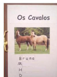
Figura 9 – Livro/ projeto “Os cavalos”

Também os projetos tiveram a sua dimensão mais escrita . No projeto sobre “Os cavalos”, as crianças decidiram que queriam fazer a comunicação do mesmo através de um livro. No fundo, um livro-documentário, em que eles, autores de texto e ilustrações, revelaram as suas.