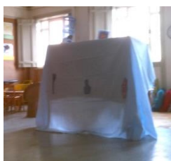
Figura 1 – Teatro de fantoches

Fez igualmente parte das minhas intenções proporcionar o contacto com materiais sensoriomotores, pelo que tive o cuidado de apresentar às crianças tipologias de materiais e suportes diferentes.