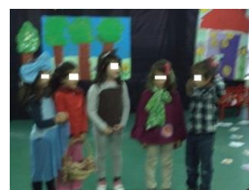
Figura 8 – Dramatização

De notar que tive cuidado e tentei ser discreta na minha intervenção com as crianças envolvidas no projeto do teatro do Capuchinho Vermelho, uma vez que é fundamental dar espaço à imaginação e às ideias das crianças, ter confiança nas “capacidades infantis”, estar aberta à expressão das crianças e acolhê-las” (Gauthier, 2000, p. 26), já que “nunca se deve mostrar como fazer mas sim indicar às crianças o que fazer” (Slade in Gauthier, 2000, p. 26)., sendo que “se é bom questionar as crianças, é, sobretudo, importante saber escutá-las. Freinet aconselha mesmo a parar de as questionar e a ouvir, de preferência, o que elas têm para dizer” (cit. in Gauthier, 2000, p. 26).