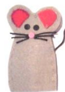
Figura 4 – Dedoque

E a história “Queres brincar comigo?”, com recurso ao dedoque. (ver anexo IV – nota de campo 7). Esta atividade permitia que as crianças tentassem adivinhar qual o animal que se seguia na história...com base na sua cauda.