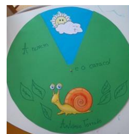
Figura 2 – História “A nuvem e o caracol”

A história “A nuvem e o caracol”, de António Torrado surge como abertura ao tema da chuva, um dos temas desenvolvidos ao longo da prática. Para além de apelar à imaginação – uma nuvem que se transforma em diferentes objectos, proporcionou a uma atividade transversal, ao nível sensorial (tato): enfeitar nuvens de cartolina com bolinhas de algodão (ver anexo IV – nota de campo 6). Estas nuvens foram posteriormente expostas no corredor, sendo proposto às famílias a criação de um móbil com gotas de água, também em cartolina, enfeitadas a gosto, constituindo-se como um dos primeiros trabalhos desenvolvidos com as famílias.