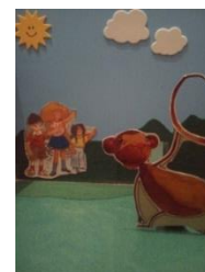
Figura 6 – Livro pop-up

O livro em pop-up: “O macaco de rabo cortado”, que construí, captou a atenção das crianças 9 , pretendendo, para além da exploração do suporte, explorar também a moral da história e as profissões. A aceitação