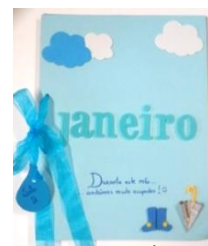
Figura 5 – Álbum de imagens

É também de ressaltar a realização de um álbum de imagem com a retrospectiva do trabalho desenvolvido durante o mês de janeiro “As crianças identificaram-se nas fotografias, e apontavam, rindo-se.” (nota de campo, 31 de Janeiro de 2014, sala de atividades), bem como o sumário (o que fizemos), que era diariamente exposto no corredor.