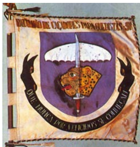
10 - Guião do Batalhão de Caçadores Paraquedistas n.º 31

Registe-se ainda que, a partir destas armas, foi confeccionado um primeiro guião, que esteve em uso pelo Batalhão de Caçadores Paraquedistas n.º 31, que se encontra publicado na já referida rúbrica “O Clube do Colecionador” da revista Boina Verde 61 .