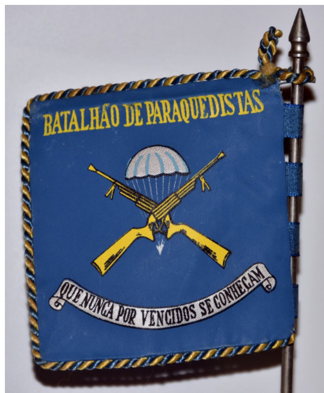
1 - Mini Guião que reproduz o guião original do Batalhão de Caçadores Paraquedistas