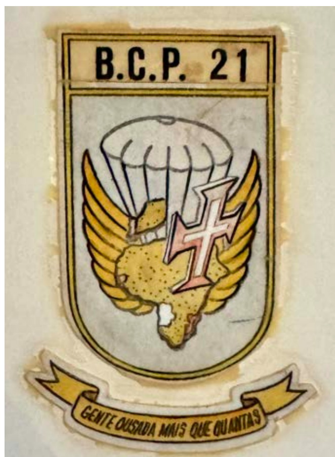
7 – Simbologia do Batalhão de Caçadores Paraquedistas n.º 21

Nesta reforma da simbologia ficava ainda definida a divisa camoniana do batalhão «Gente ousada mais que quantas» que viria mais tarde a ser recuperada aquando da estruturação heráldica para a Base Operacional de Tropas Paraquedistas n.º 1.