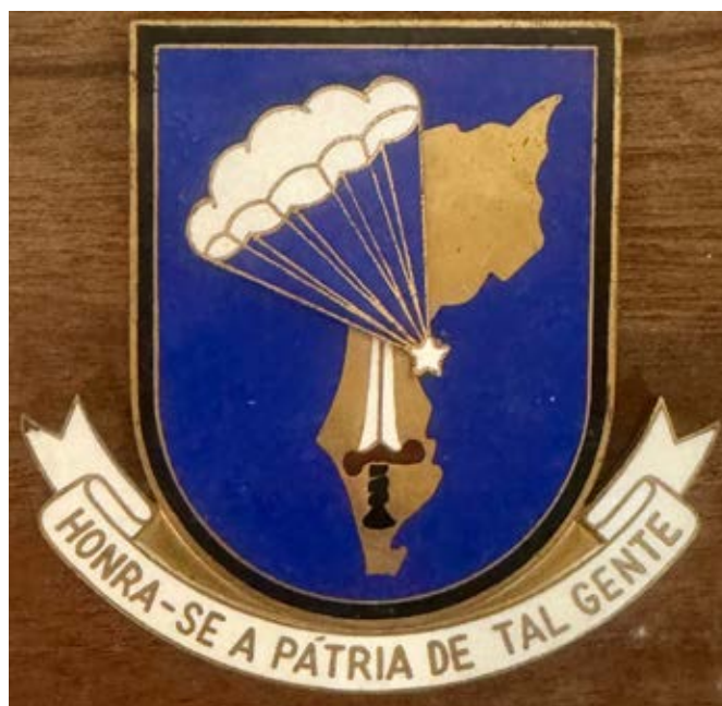
11 – Simbologia do Batalhão de Caçadores Paraquedistas n.º 31

A nova simbologia que foi criada para o Batalhão de Caçadores Paraquedistas n.º 31 era completamente dissemelhante da anterior. Neste caso a composição, embora inserida num escudo, era mais um logótipo do que uma estruturação heráldica.