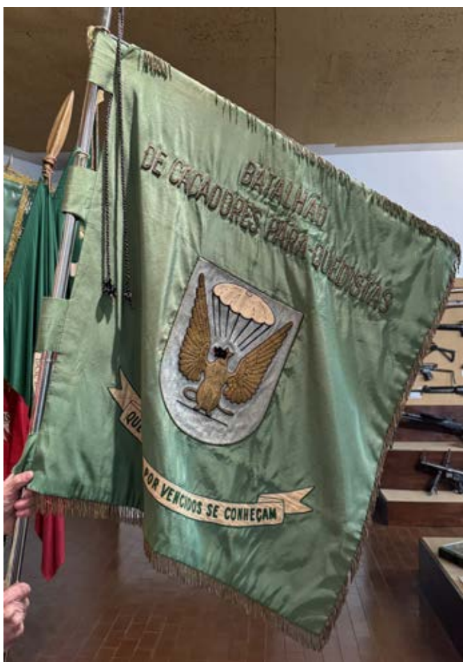
4 – Guião do Batalhão de Caçadores Paraquedistas

Não obstante, na estruturação heráldica, a descrição não seria a mais acurada em termos heráldicos, sendo que o azul-celeste não é um esmalte heráldico, embora no norte da Europa o azul seja representado de forma mais clara, caso por exemplo da bandeira da Suécia, e a representação do grifo não era a heráldica 33 .