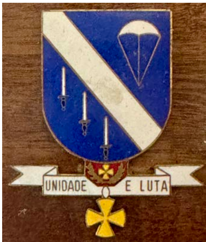
12 – Simbologia do Batalhão de Caçadores Paraquedistas n.º 12

Pendente do escudo e sobreposta à divisa a insígnia estilizada da Medalha Militar da Cruz de Guerra de primeira classe.