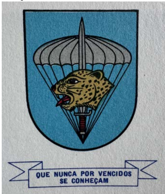
8 – Brasão-de-armas do Batalhão de Caçadores Paraquedistas n.º 31

A divisa repetia a do Batalhão de Caçadores Paraquedistas original e do Regimento de Paraquedistas 56 .