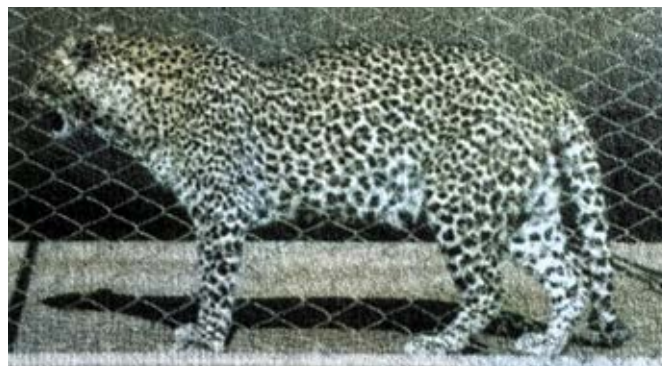
9 – Nacala, a mascote do Aeródromo Base n.º 5, Moçambique

Quanto à cabeça de leopardo das armas, esta deriva da existência, no referido Aeródromo Base n.º 5, de uma mascote, um leopardo de nome Nacala 60 , com o qual os militares do batalhão contactavam. Tal permite também datar as armas entre junho de 1965, altura em que se iniciou a atividade operacional do batalhão nesta localidade e outubro do mesmo ano, altura em que a mesma cessou.