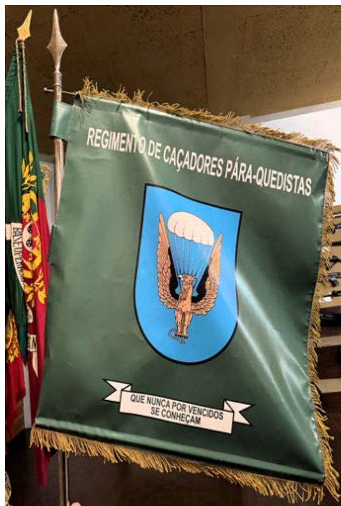
5 - Guião do Regimento de Caçadores Paraquedistas

A constituição do Regimento de Caçadores Paraquedistas havida em 5 de maio de 1961 34 não traria qualquer modificação heráldica, salvo a designação da unidade, que se refletia na legenda na parte superior do guião.