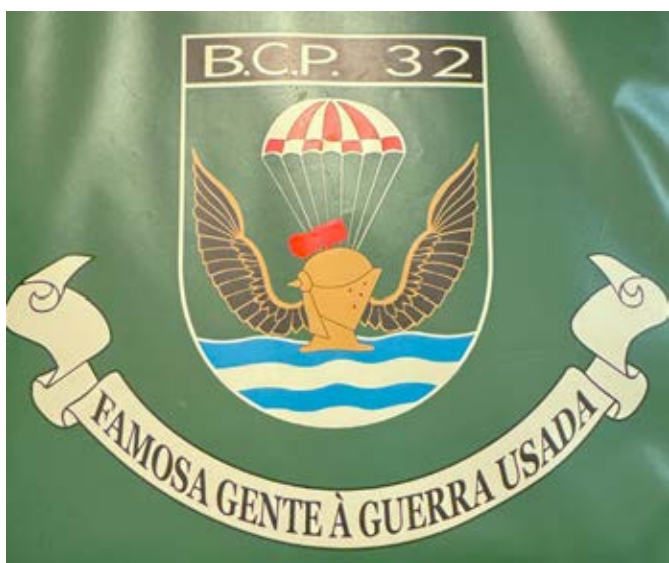
15 – Simbologia do Batalhão de Caçadores Paraquedistas n.º 32

da sigla do organismo dentro do escudo em chefe diminuto, a localização do elmo sobre o ondado e o facto de este estar voltado à sinistra o que, em heráldica, indica bastardia 69 .