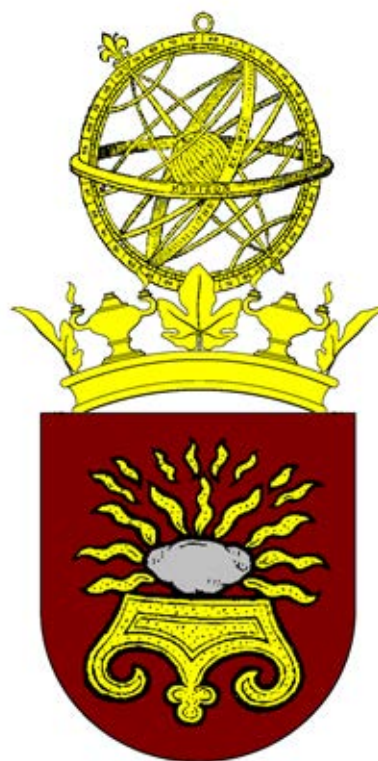
38 – Ensaio de armas para o Instituto Superior de Engenharia de Lisboa

Considera-se, como melhor proposta, a seguinte ordenação e simbologia para as armas do Instituto Superior de Engenharia de Lisboa (fig. 39):