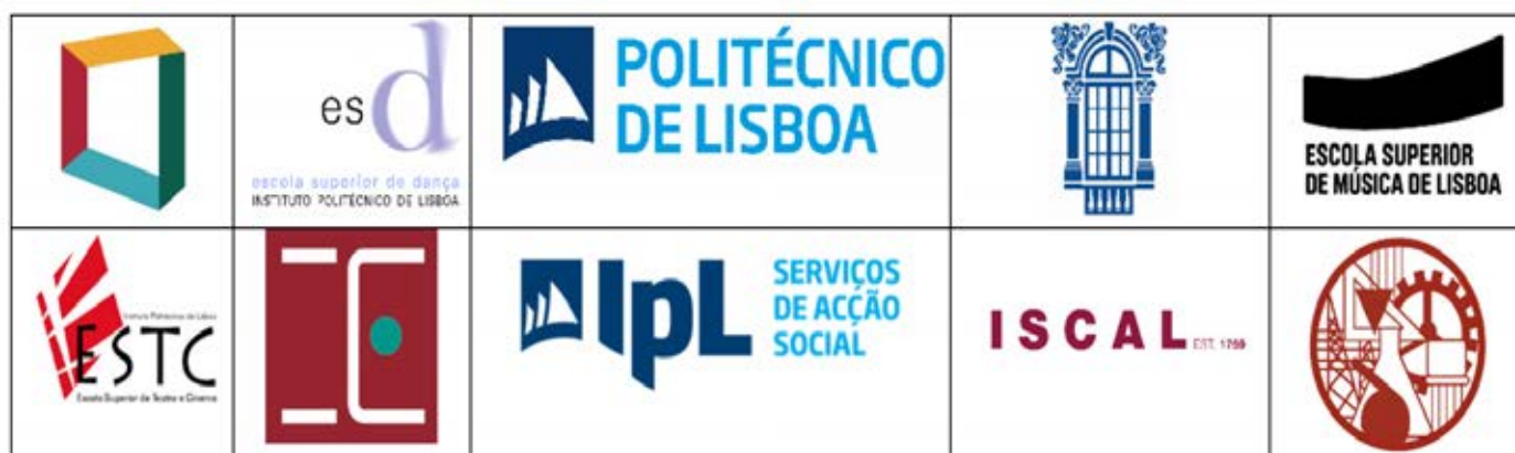
42 – Conjunto dos logótipos do Politécnico de Lisboa e respetivas unidades orgânicas