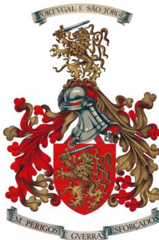
6 – Logótipo do Exército Português