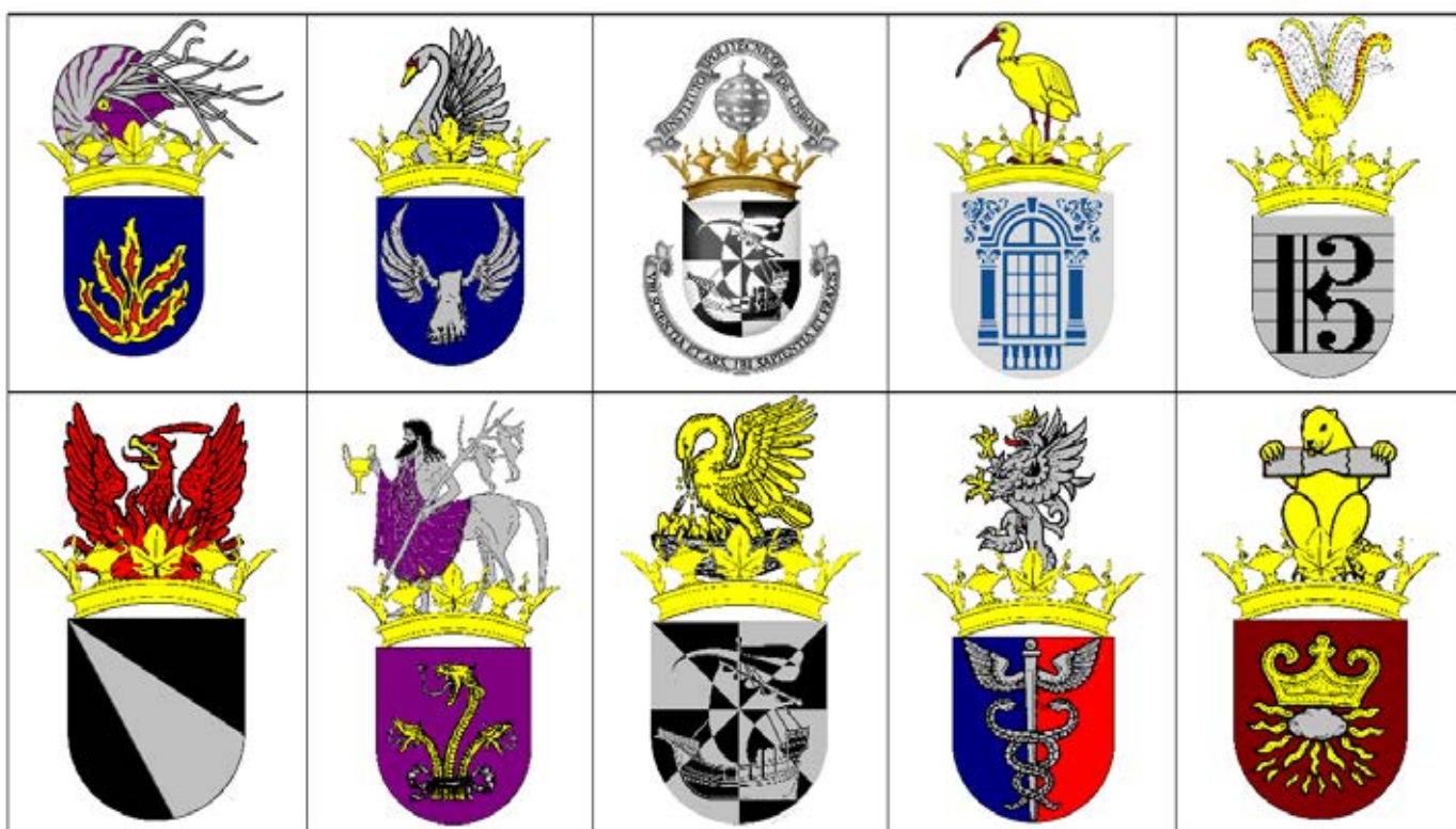
43 – Armas em vigor do Politécnico de Lisboa e proposta de ordenação de armas para as respetivas unidades orgânicas

nicas do Politécnico de Lisboa continua por acontecer e é rejeitada, sem sequer poder ser apreciada, ou discutida.