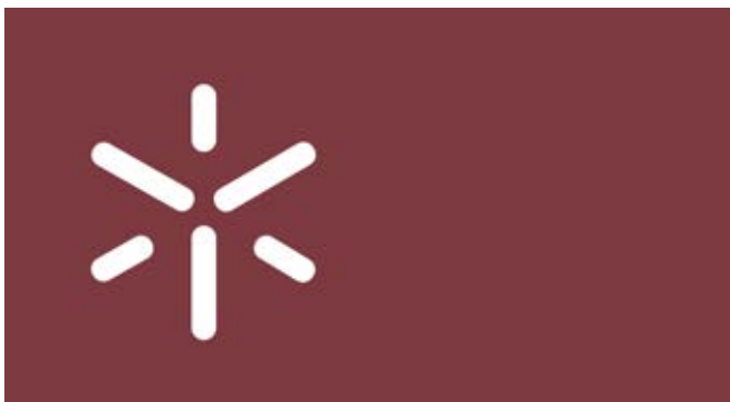
8 – Armas da Universidade do Minho