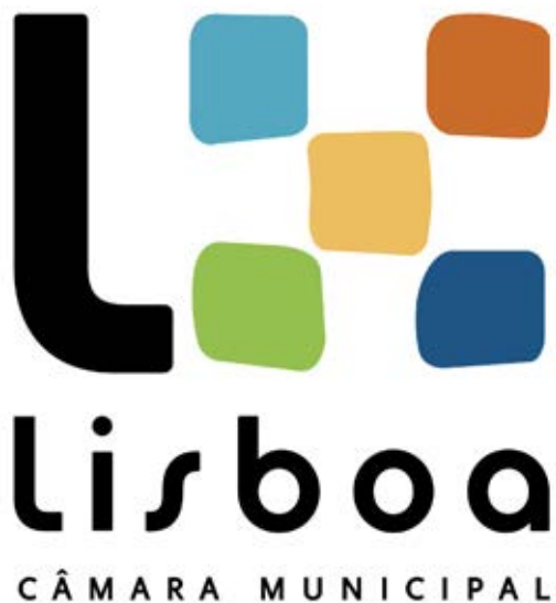
4 - Atual logótipo da Câmara Municipal de Lisboa