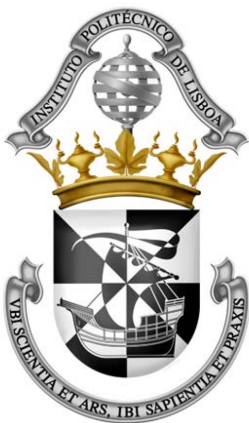
14 – Armas do Instituto Politécnico de Lisboa

sidia tinha simbologia, vulgarmente designada como logótipo, da qual derivava a sua vexilologia e falerística, mas não tinha heráldica própria, nem traje para os professores 16 . Daqui derivou o pedido de uma proposta para a simbologia heráldica da instituição a que presidia. A proposta viria a ser aceite e o Instituto adotava simbologia heráldica 17 (fig. 14).