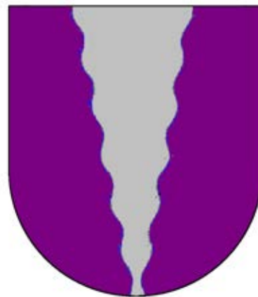
36 - Ensaio de ordenação do campo do escudo para as armas do Instituto Superior de Engenharia de Lisboa