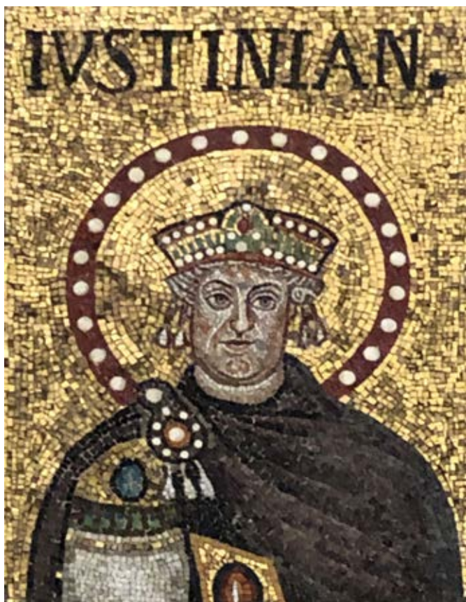
37 – Mosaico com representação do Imperador Justiniano.