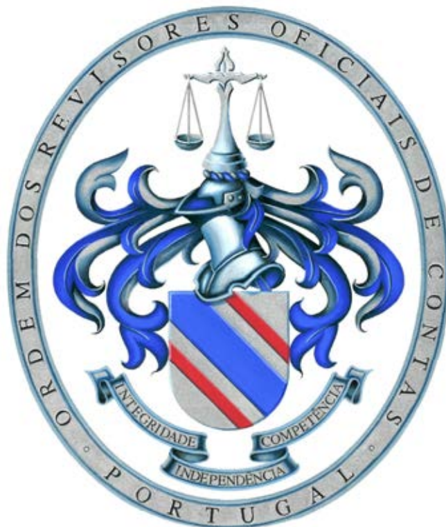
10 – Logótipo da Ordem dos Revisores Oficiais de Contas