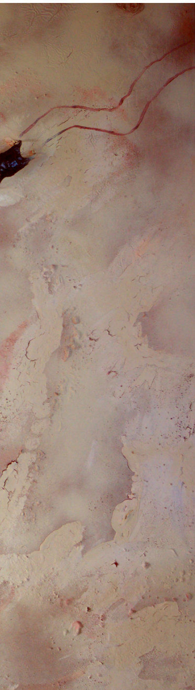
Sahel - Water tank 1771