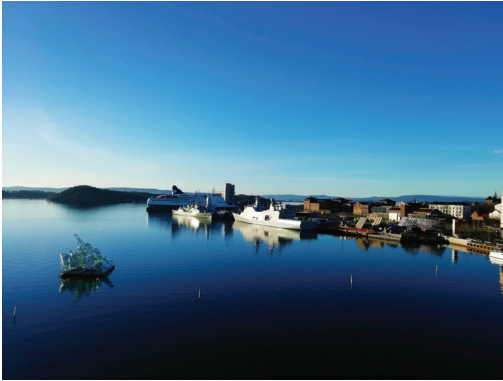
The landscape seen from my favourite Norwegian spot Raquel Miranda