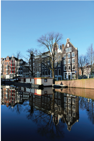
As inconfundíveis casas holandesas Inês Luís