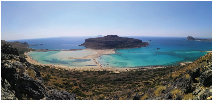
A dimensão da tranquilidade, Balos lagoon Francisco Vaz