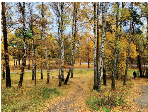
Imersão impressionista Vera Amorim