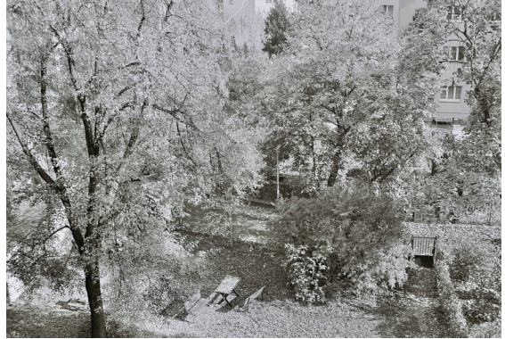
A varanda de casa em Podbabská, Prague 6 Carolina Sousa