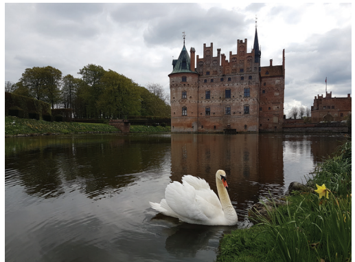
O nascer da luz João Belourico