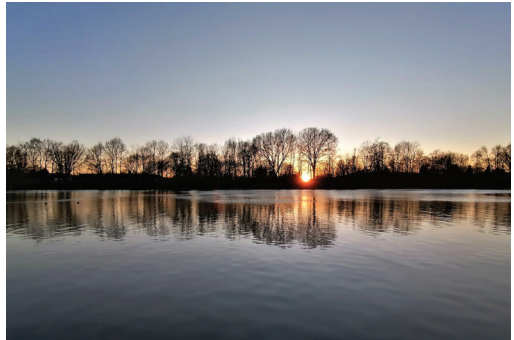
O sol nunca deixa de brilhar Inês Luís